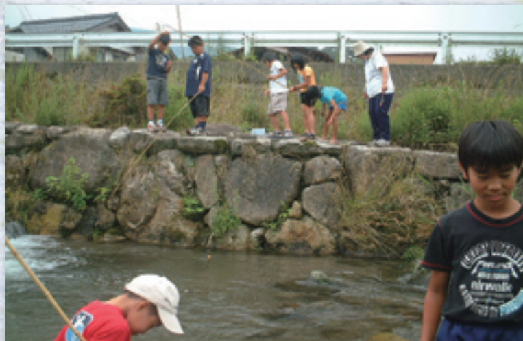
船谷川での体験学習の様子