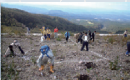
日野川、大山での清掃ボランティアやスポーツ教室の様子