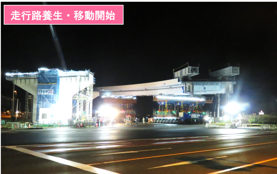
走行路養生・移動開始