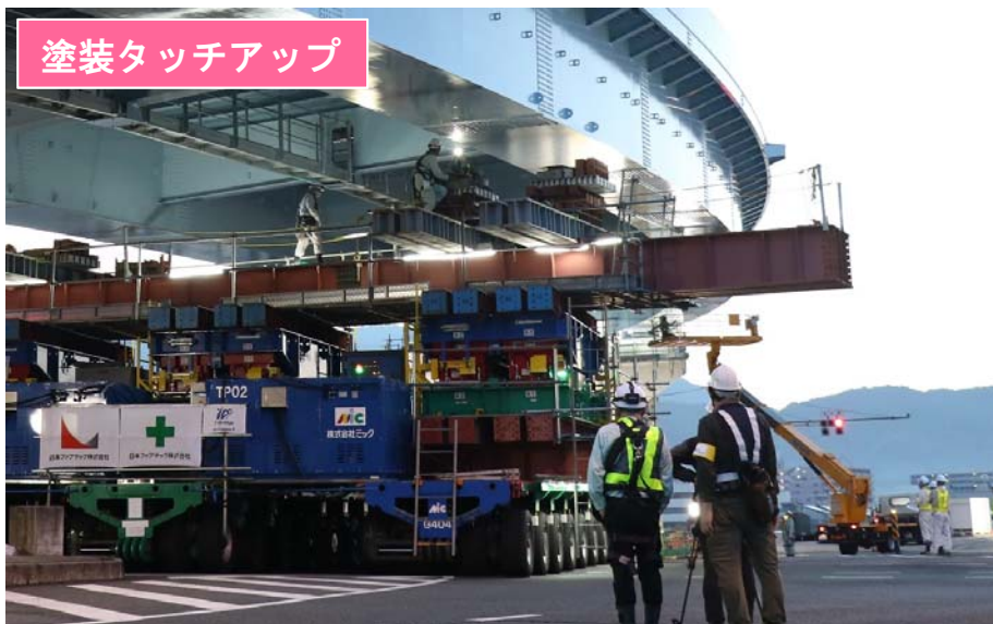
塗装タッチアップ