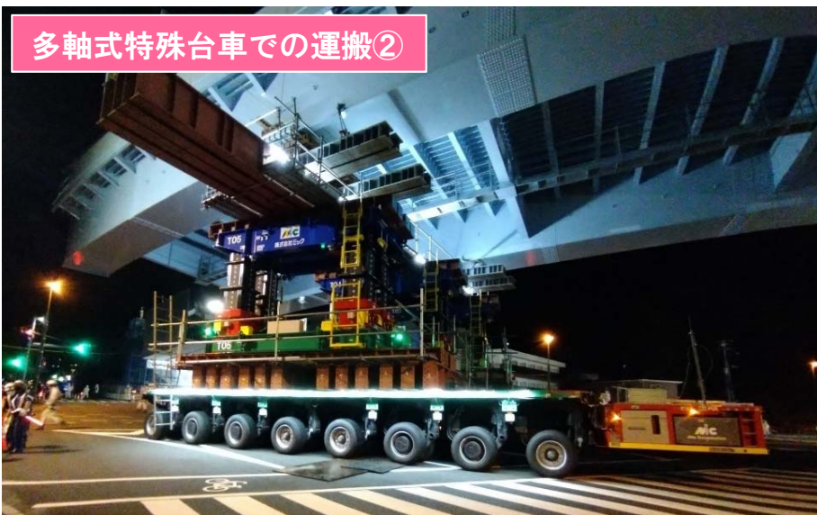
多軸式特殊台車での運搬②