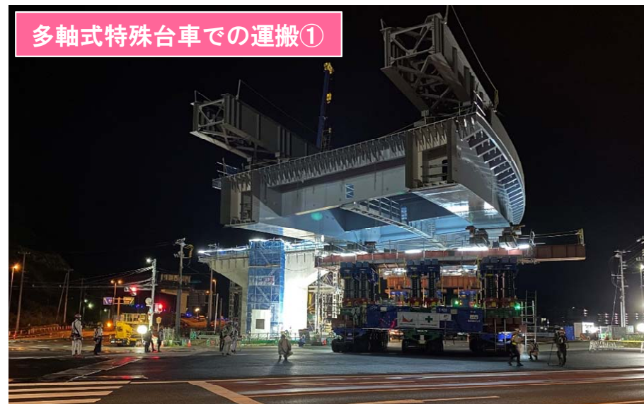
多軸式特殊台車での運搬①