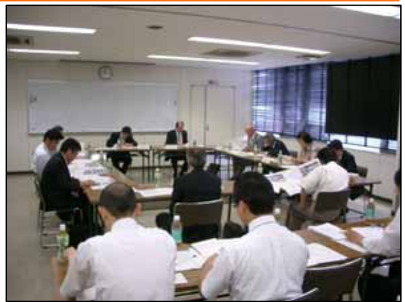
第1回 みちづくり協議会の様子

1;さまざまな立場...本協議会では、利用者、市民・地域、学識経験者、経済界、関係行政機関のこと