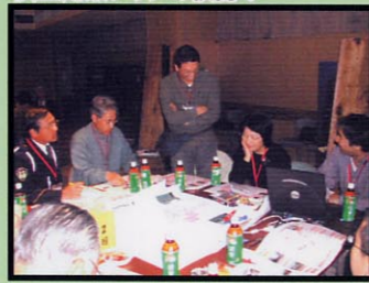
安全対策プランの検討!