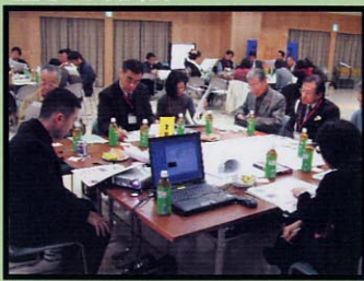
前回のふりかえり