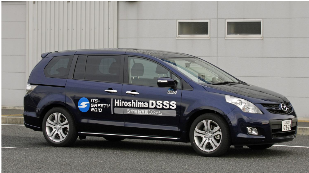
ITS車載機及びドライブレコーダーを搭載した実験車両