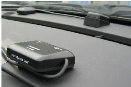
ダッシュ上の通信アンテナで、道路に設置されたセンサーやカメラの情報をやり取りします