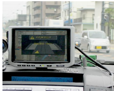
ITS車載機のナビゲーション画面上に安全運転をサポートする効果的な情報を提供します