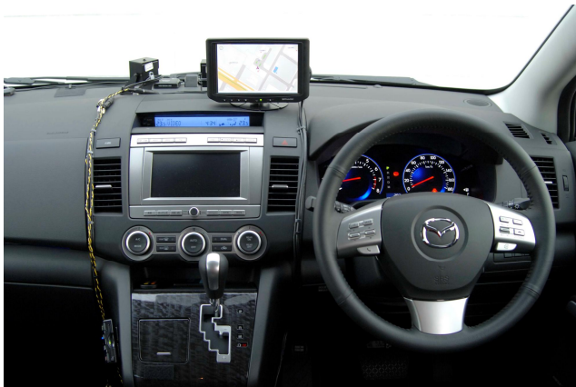
ITS実験車両のコックピット