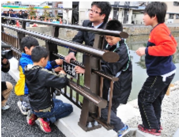
橋名板の設置時（イメージ） H24.4.7 国道31号大浜橋