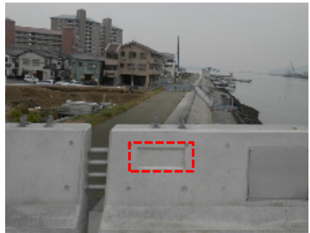
橋名板の設置箇所（実際）