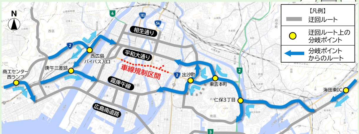
車線規制区間を迂回する経路イメージ