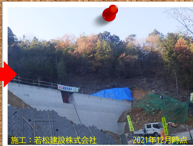
施工：若松建設株式会社