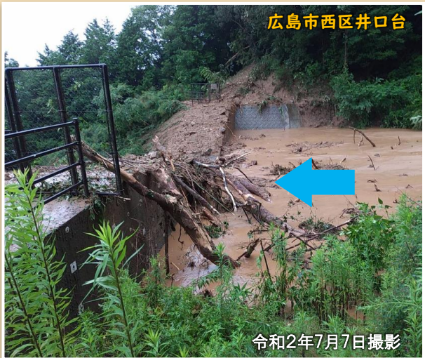
広島市西区井口台

土石流は、川の上流の急な斜面から崩れた土や石が、大雨によって水と一緒に一気に流れ出てくることを言います。砂防ダムは、その土石流から皆さんを守るためにつくられています。