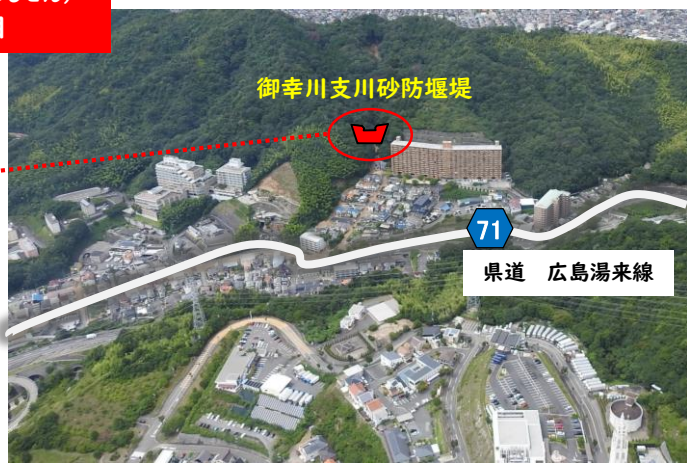
71 県道 広島湯来線