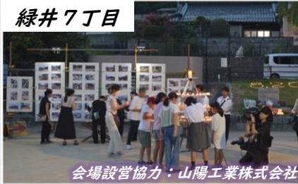
会場設営協力：山陽工業株式会社