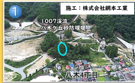
施工：株式会社網本工業