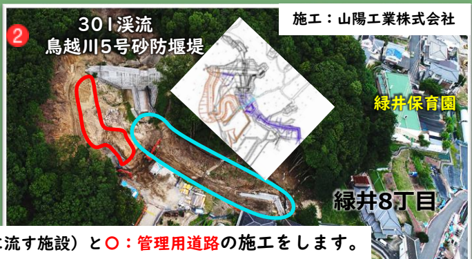
施工：山陽工業株式会社