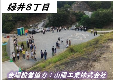
会場設営協力：山陽工業株式会社