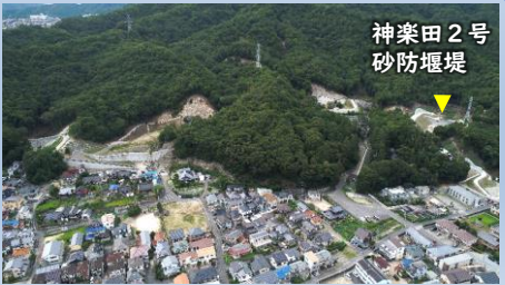
神楽田2号 砂防堰堤