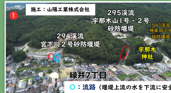
施工：山陽工業株式会社