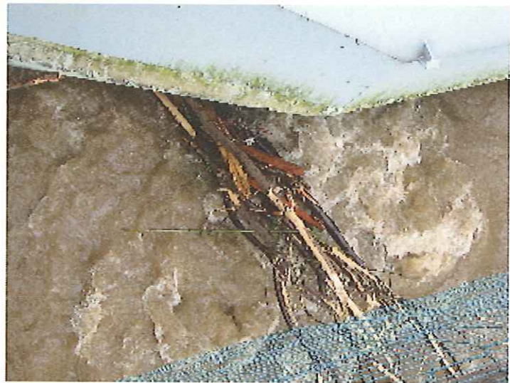
写真：ゲートに挟まった流木