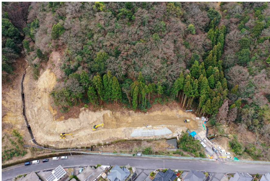
【施工状況（上空より）】