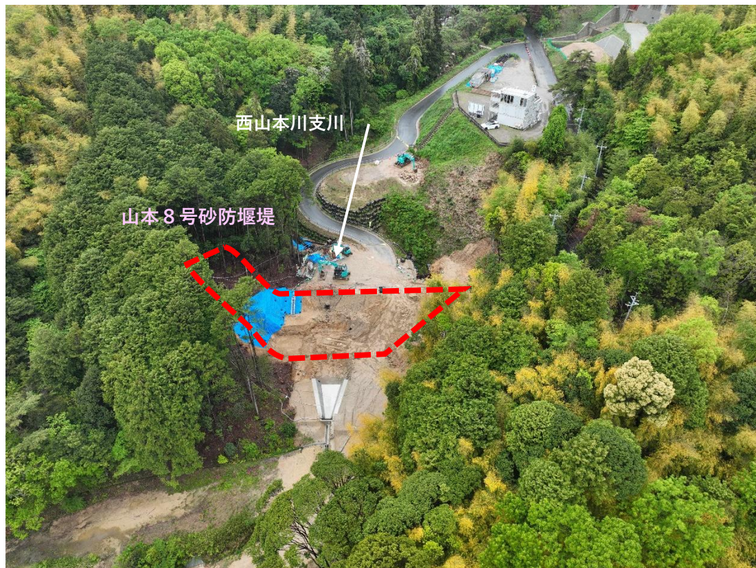
【 施工状況 】