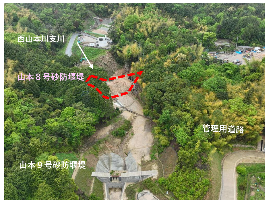
【 全 景 】