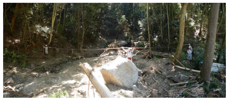
溪流調査(口田南3丁目・小田川)