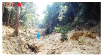
土石流警報装置設置状況