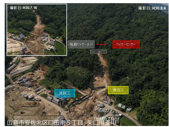
広島市安佐北区口田南5丁目 矢口川支川