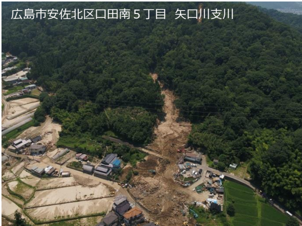
広島市安佐北区口田南5丁目 矢口川支川