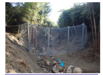
強靱ワイヤネット設置状況