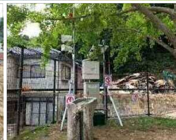
土石流警報装置設置状況