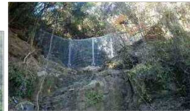
強靱ワイヤーネット設置状況