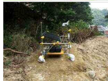
監視カメラ設置状況