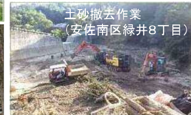
土砂撤去作業 (安佐南区緑井8丁目)