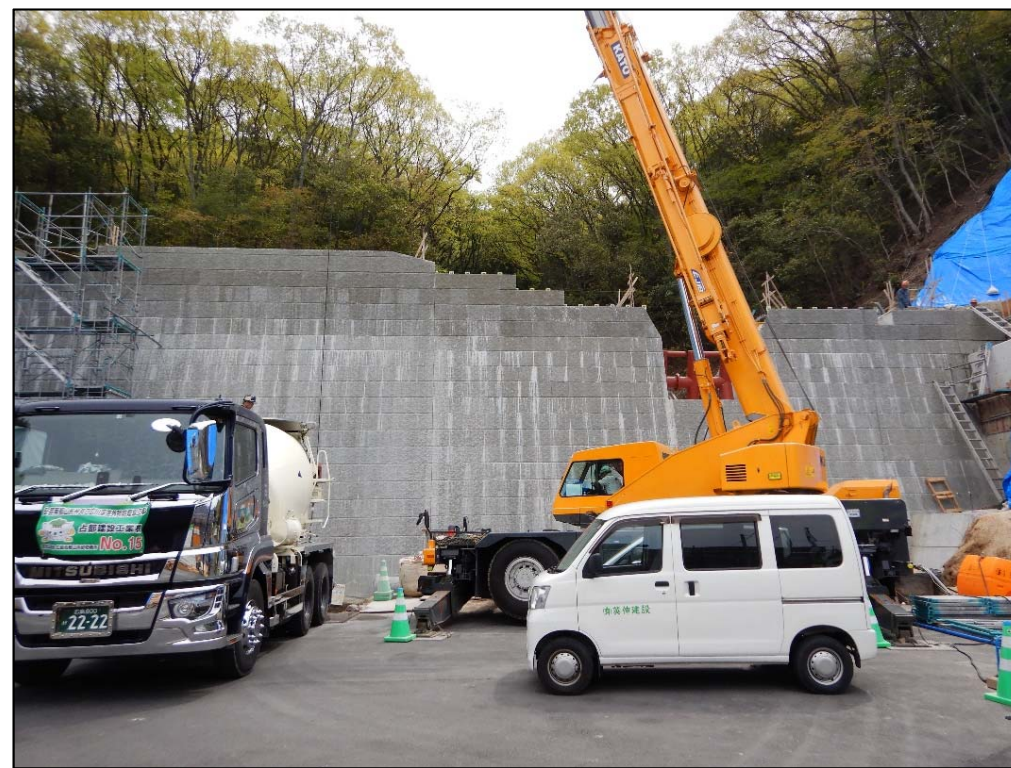
コンクリート打設状況②