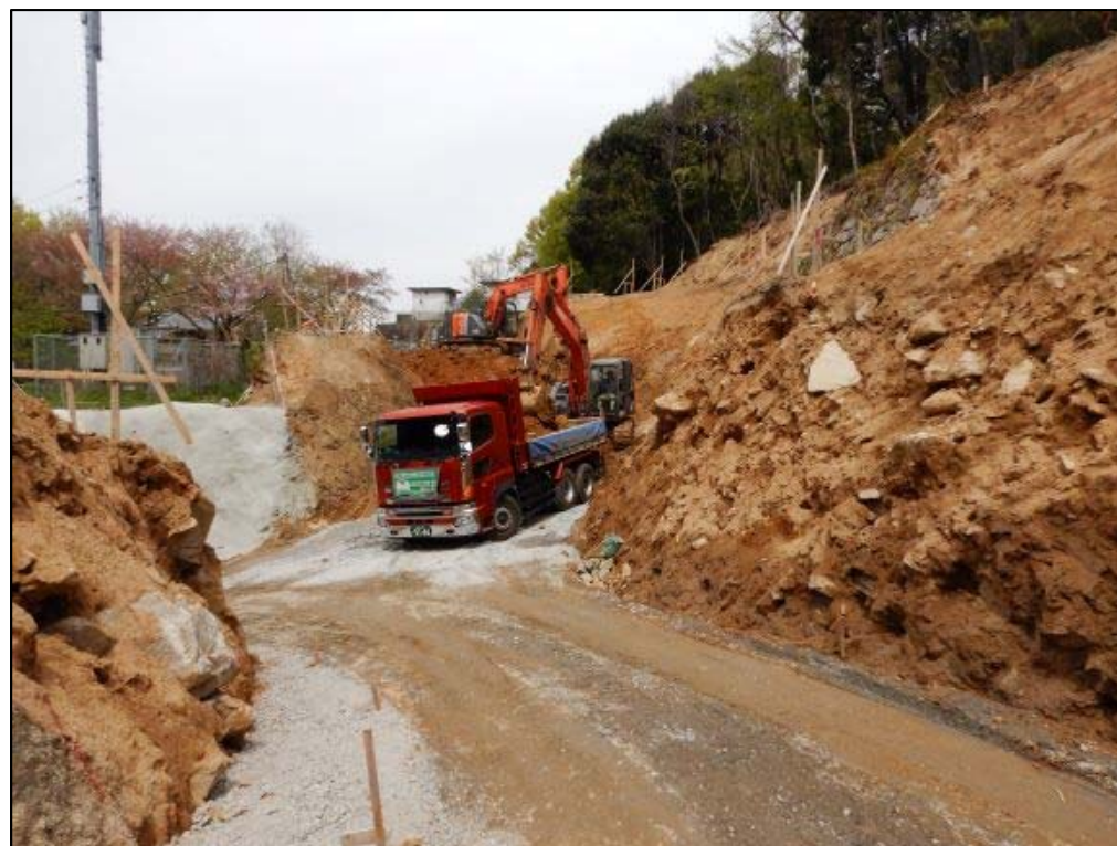
工事用道路施工状況