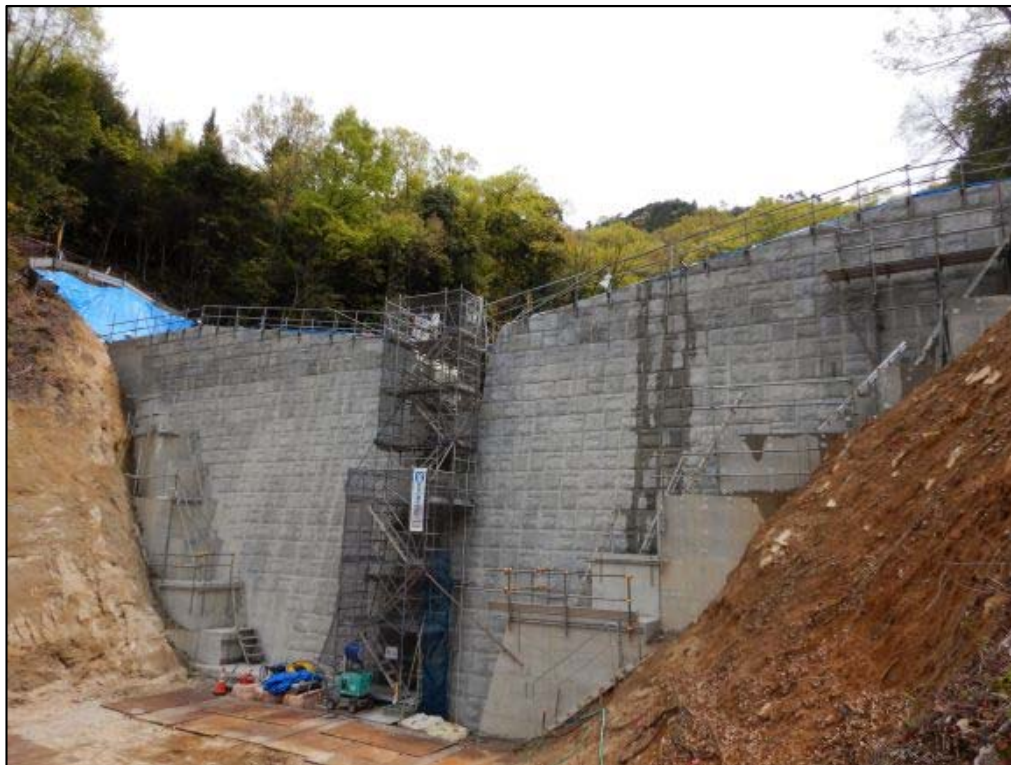
下流左岸より(本堤)