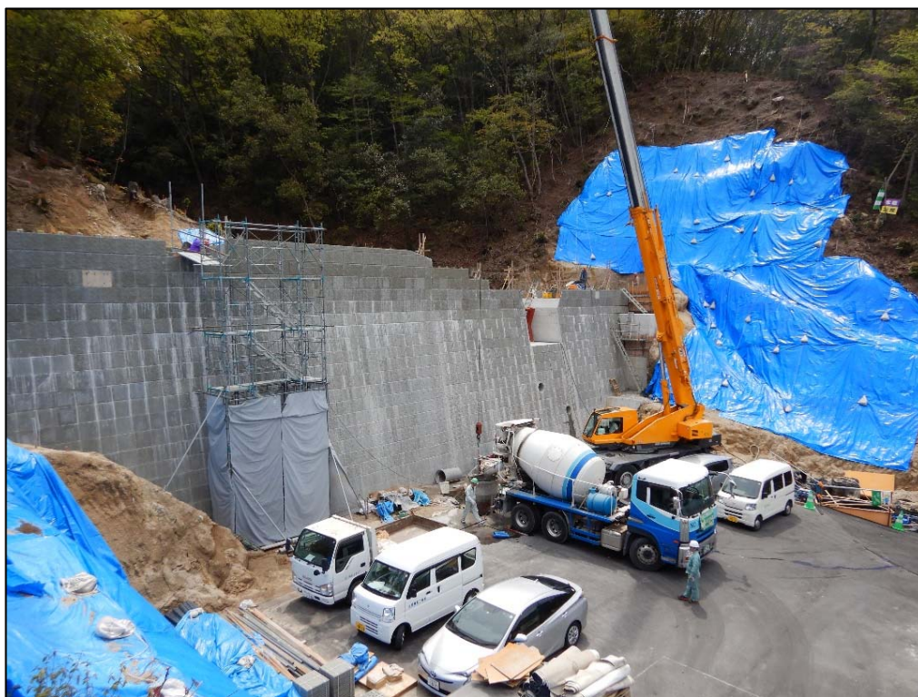
コンクリート打設状況①