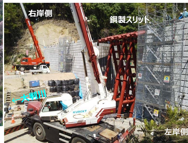
大判川施工状況（左岸側より）