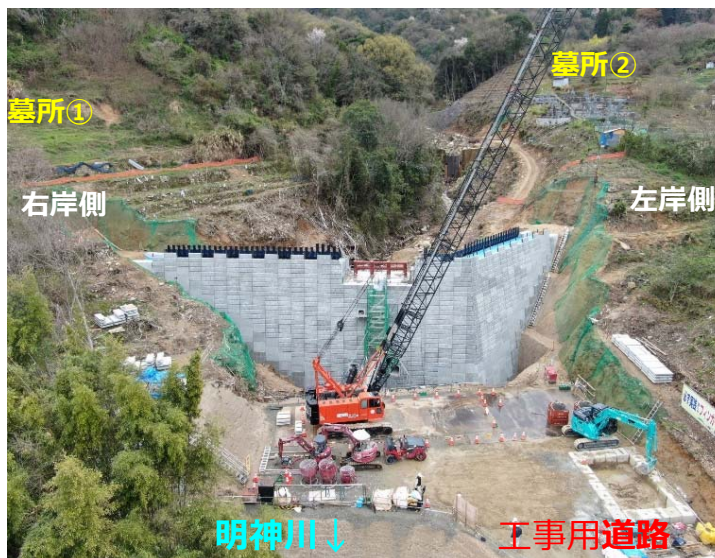
堰堤施工状況(下流斜め)