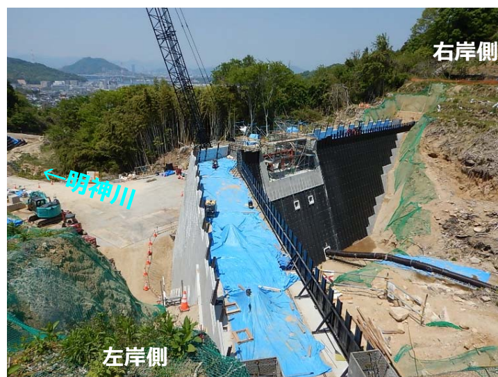
堰堤施工状況(左岸側より)