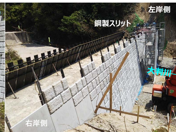
大判川施工状況（右岸側より）