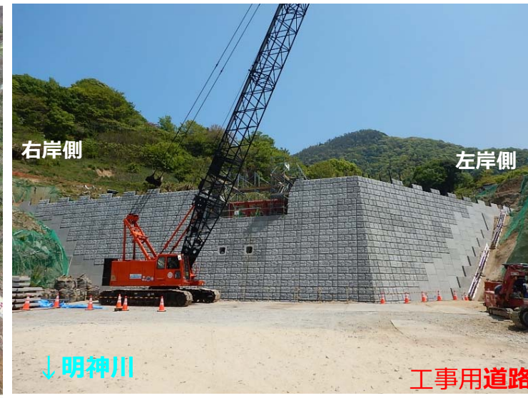
堰堤施工状況(堰堤直下)