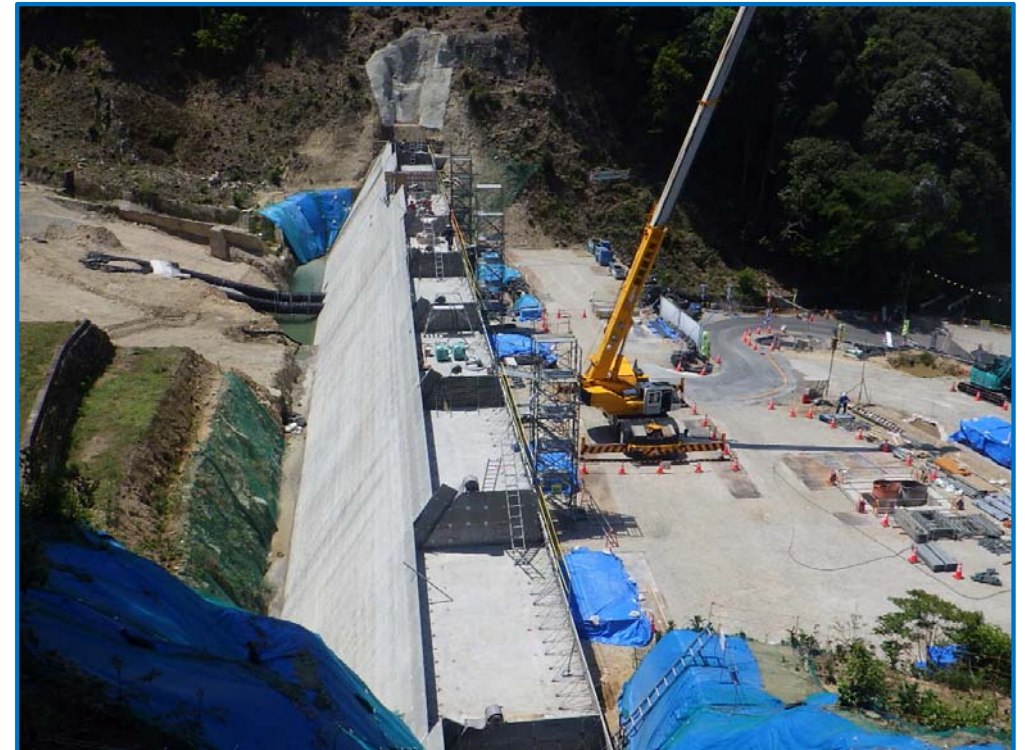
砂防堰堤本体のコンクリート打設状況