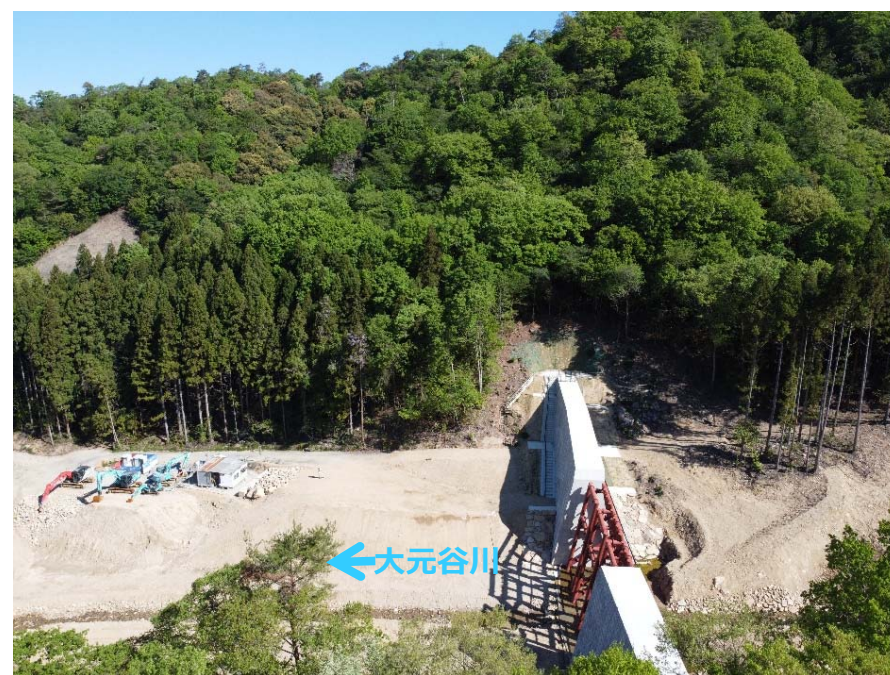
着手前 道路付替状況(左岸側より)