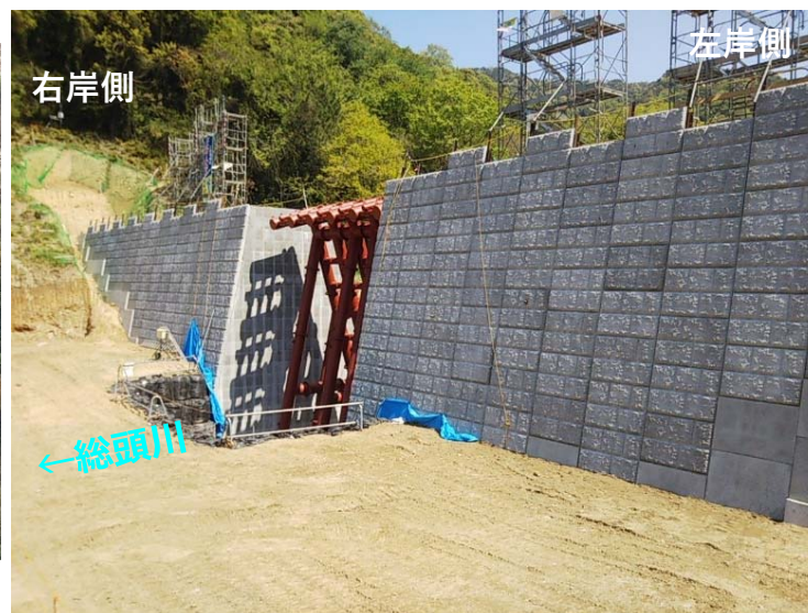
総頭川施工状況（左岸側より）