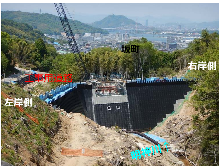
堰堤施工状況(上流より)