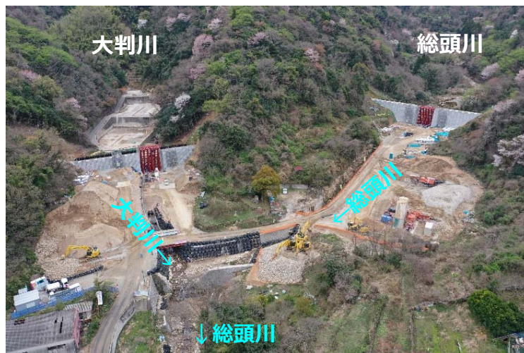
総頭川・大判川施工状況 (R2.3末時点)