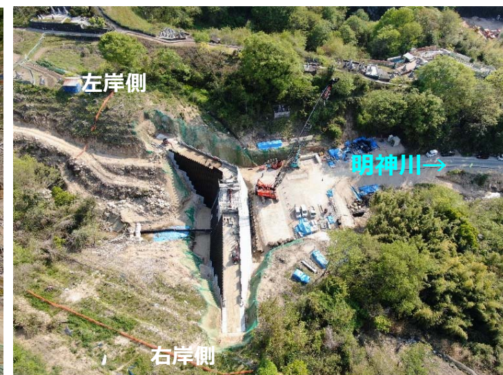
堰堤施工状況(右岸側より)