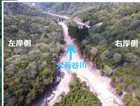
着手前(上流から撮影)