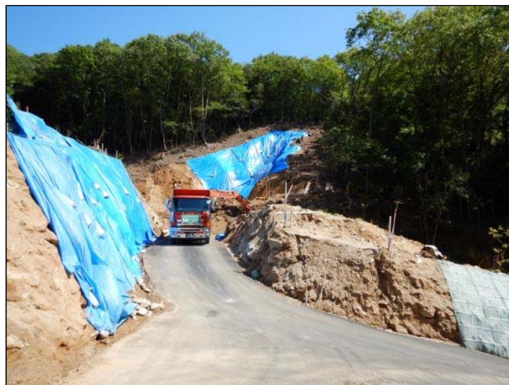
掘削土砂搬出状況