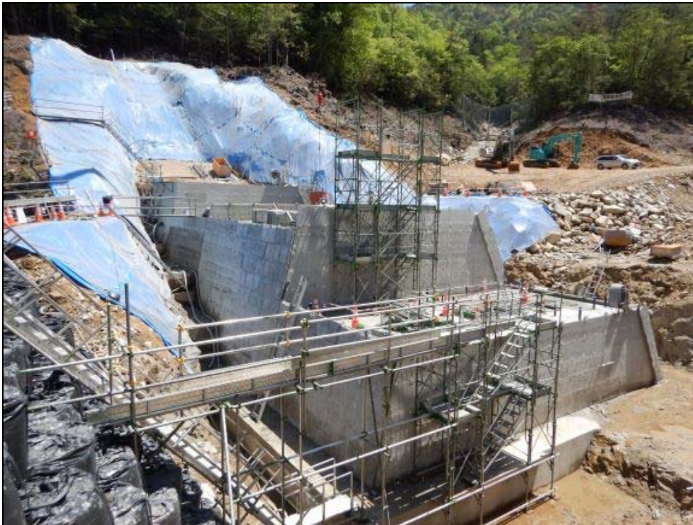
コンクリート打設状況①