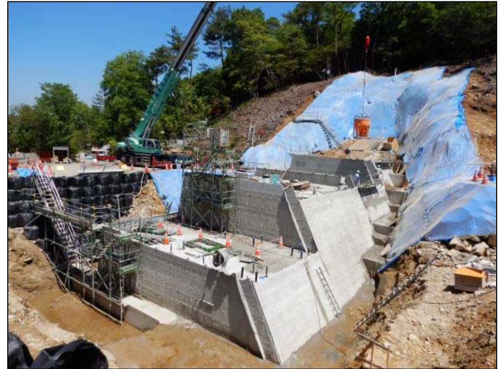
コンクリート打設状況②