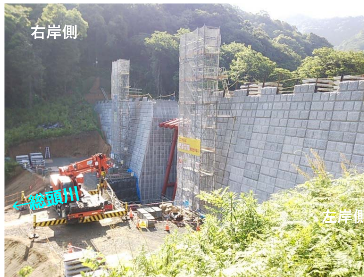
総頭川施工状況（左岸側より）