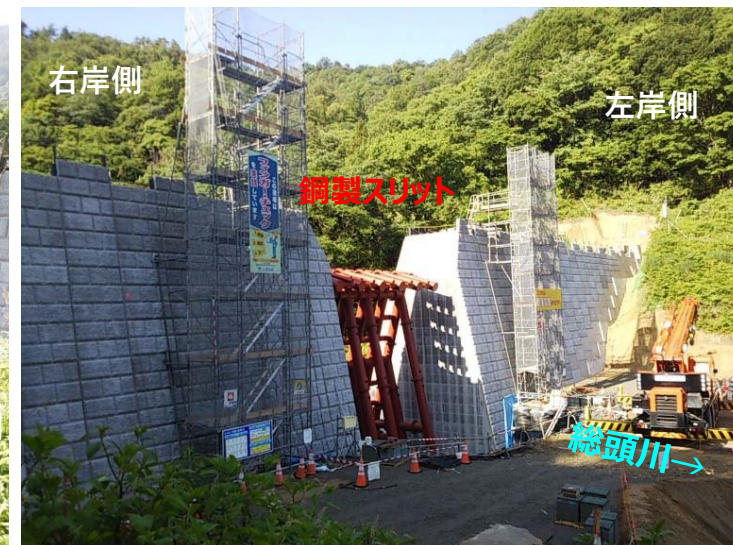
総頭川施工状況（右岸側より）