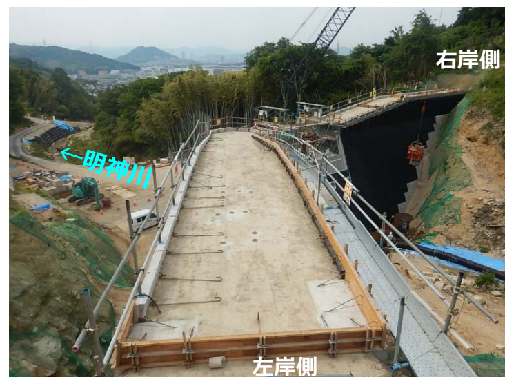
堰堤施工状況(左岸側より)