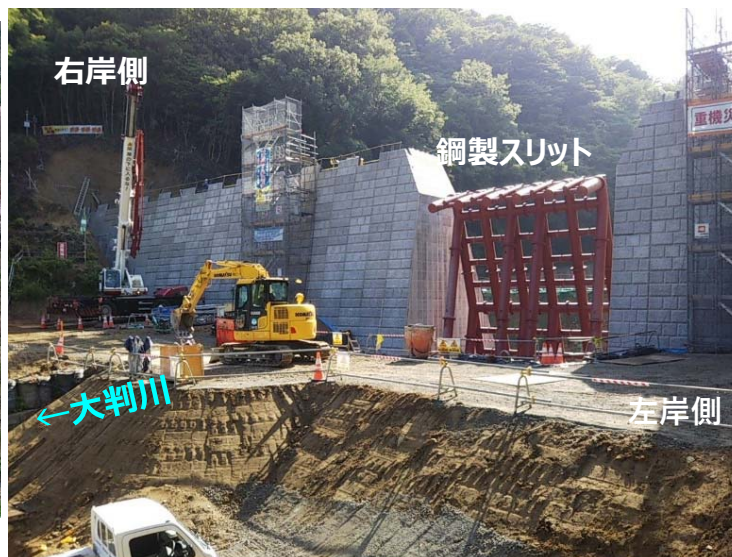
大判川施工状況（左岸側より）