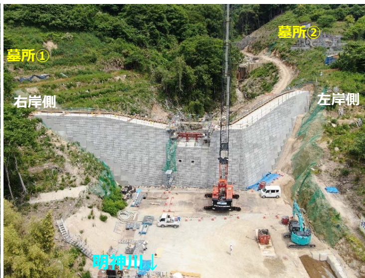
堰堤施工状況(下流斜め)