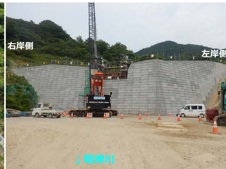
堰堤施工状況(堰堤直下)