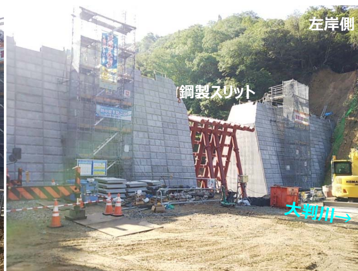
大判川施工状況（右岸側より）