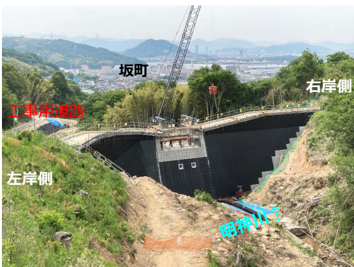
堰堤施工状況(上流より)