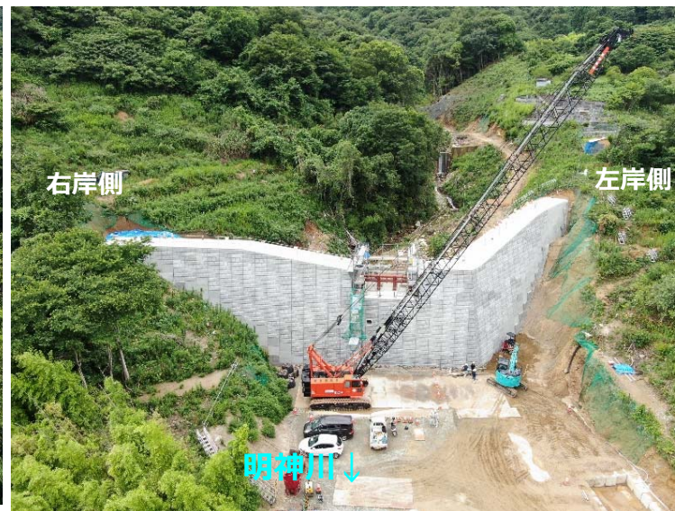
堰堤施工状況(下流斜め)