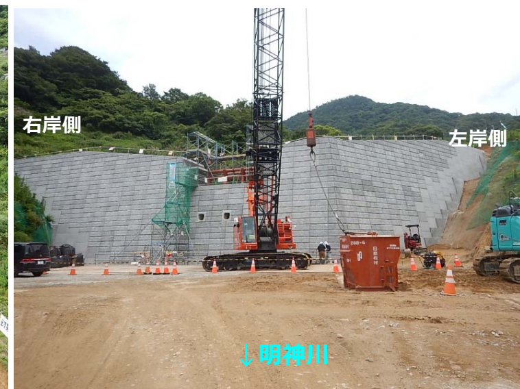
堰堤施工状況(堰堤直下)