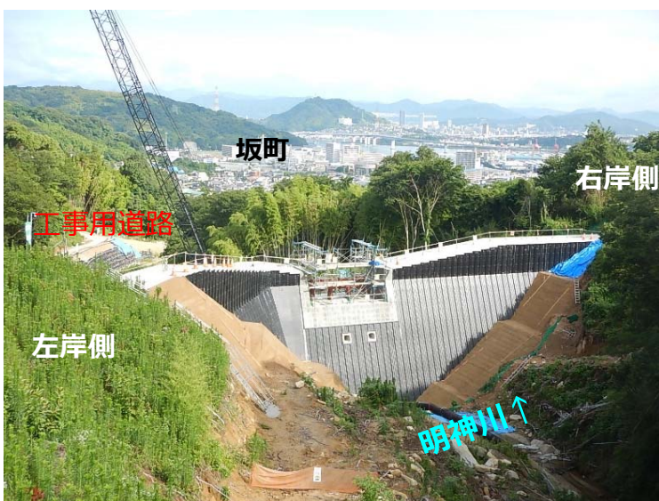
堰堤施工状況(上流より)