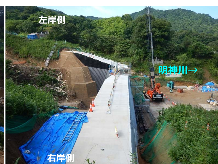
堰堤施工状況(右岸側より)