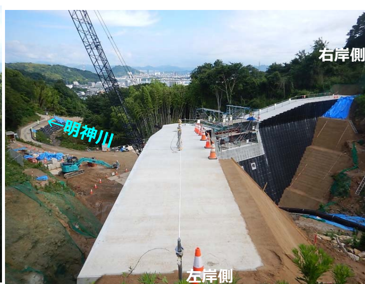
堰堤施工状況(左岸側より)