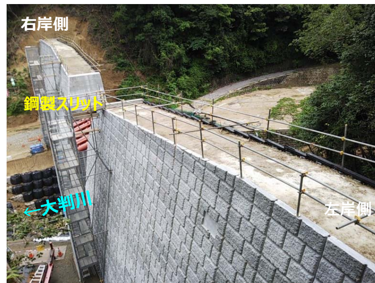
大判川施工状況（左岸側より）