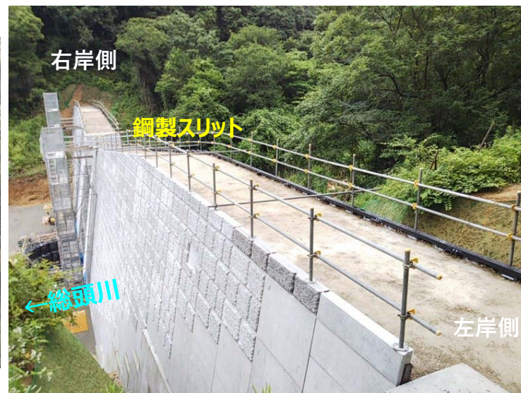
総頭川施工状況（左岸側より）