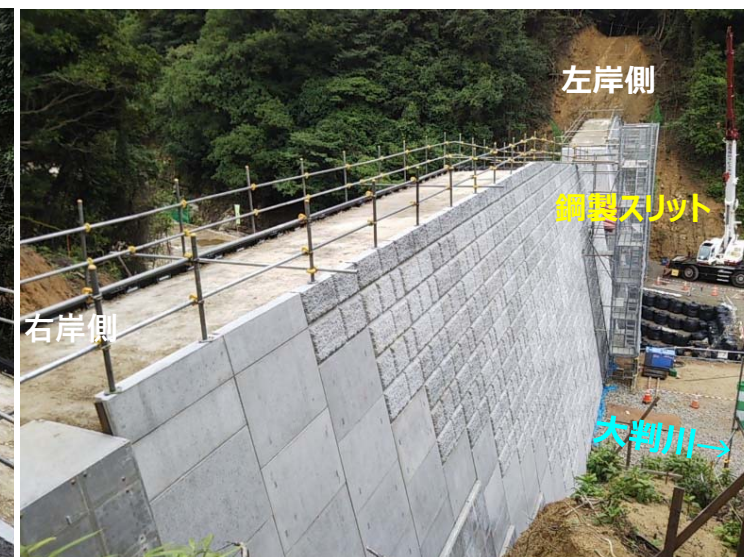
大判川施工状況（右岸側より）