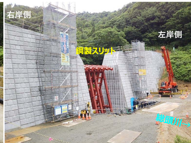
総頭川施工状況（右岸側より）