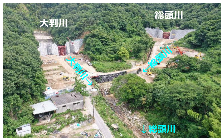
総頭川・大判川施工状況 (R2.6末時点)