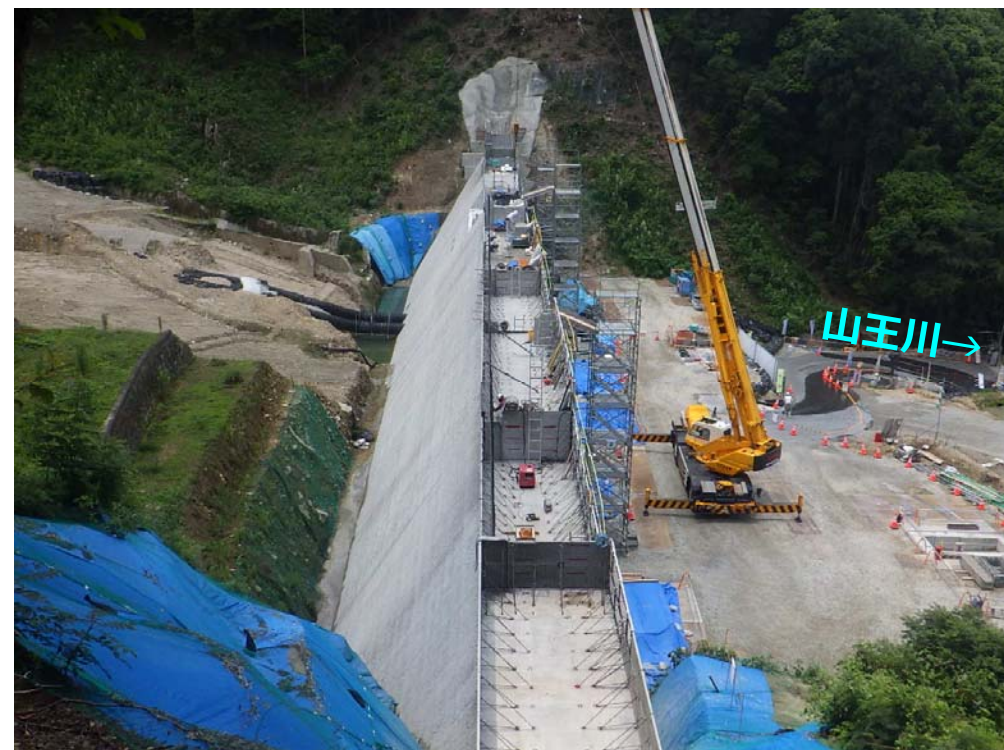
砂防堰堤本体のコンクリート打設状況