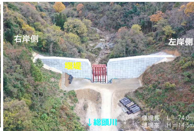
総頭川施工状況（下流側より）