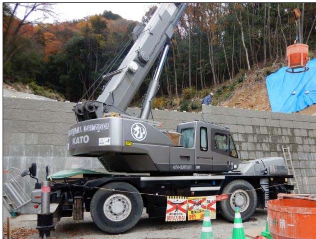
コンクリート打設状況①