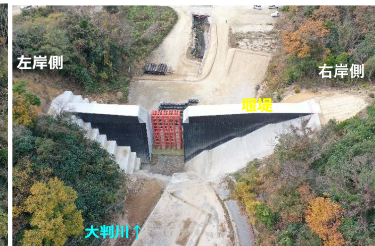
大判川施工状況（上流側より）