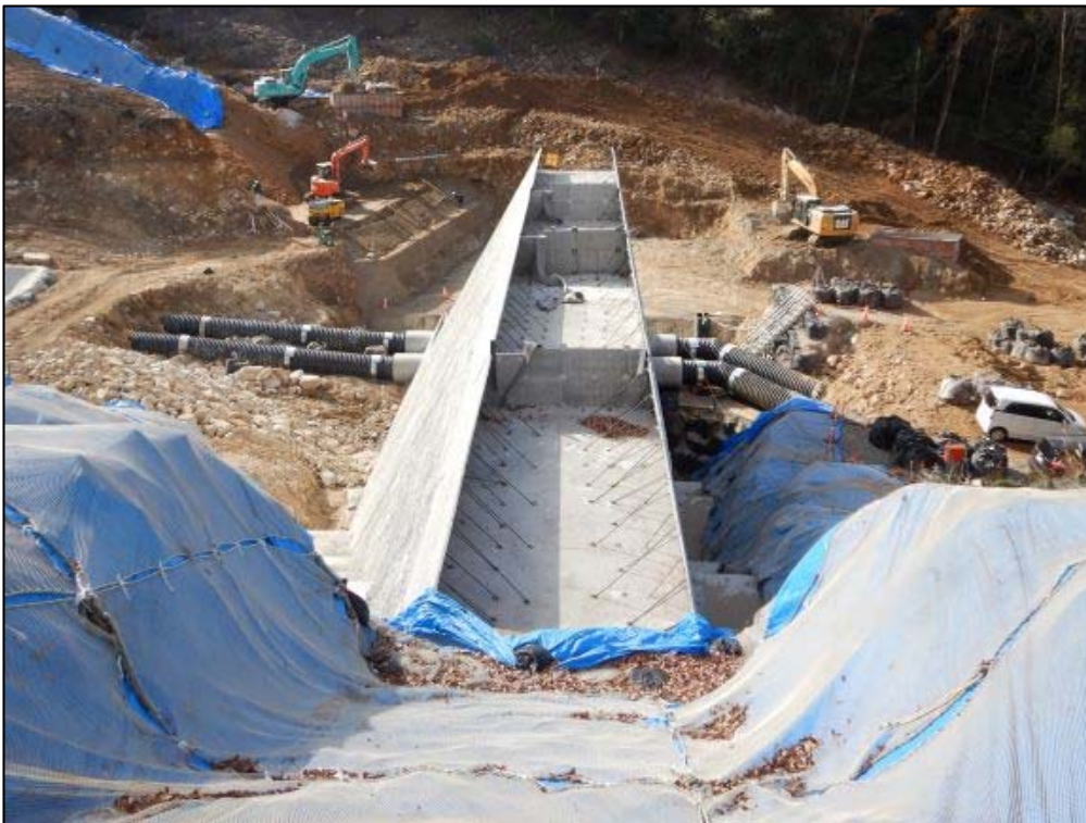
砂防堰堤施工状況