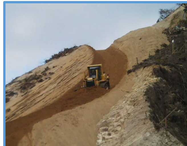
管理道の法面掘削実施状況