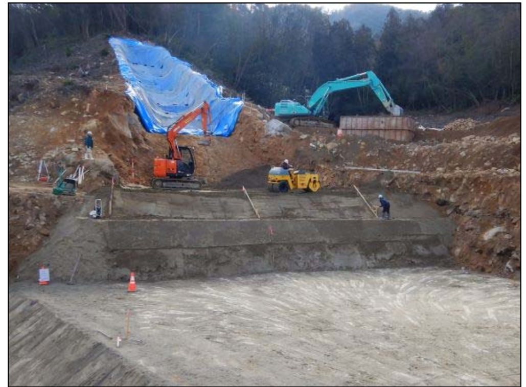
ソイルセメント置換施工状況