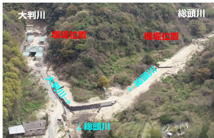
総頭川・大判川施工状況 (着手前H31.4時点)