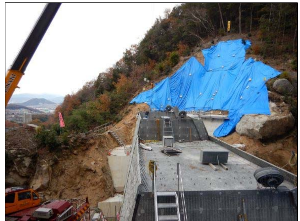
コンクリート打設状況②