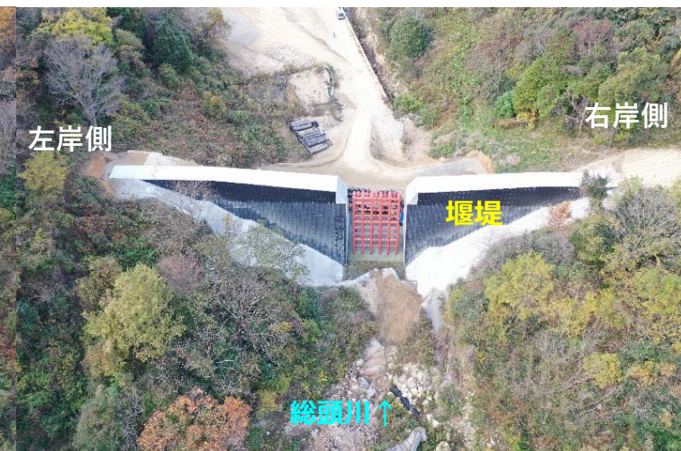
総頭川施工状況（上流側より）