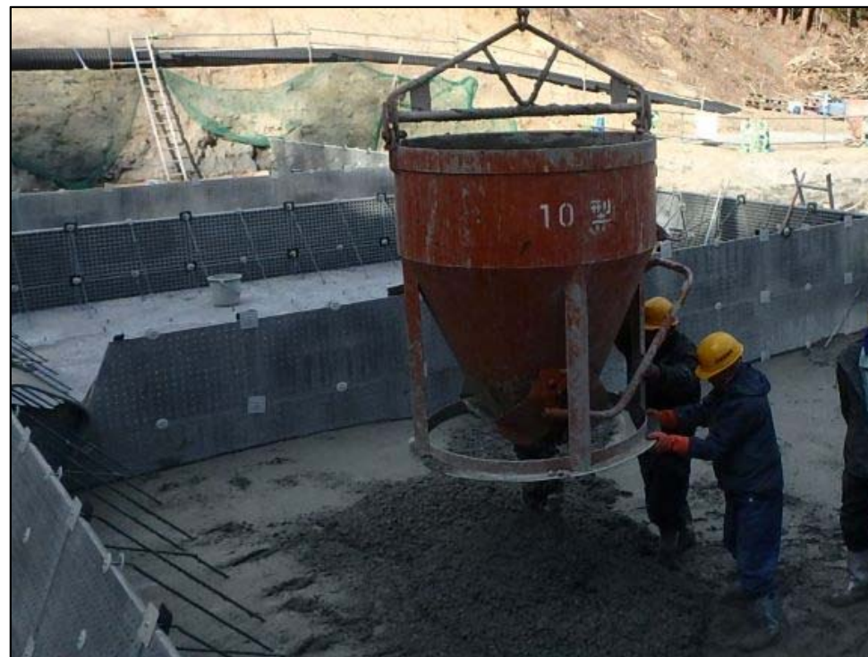
コンクリート打設状況②