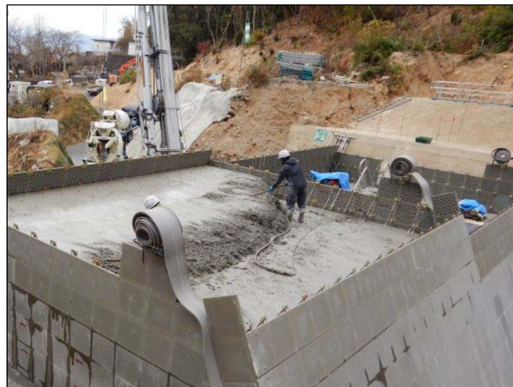
コンクリート打設状況②