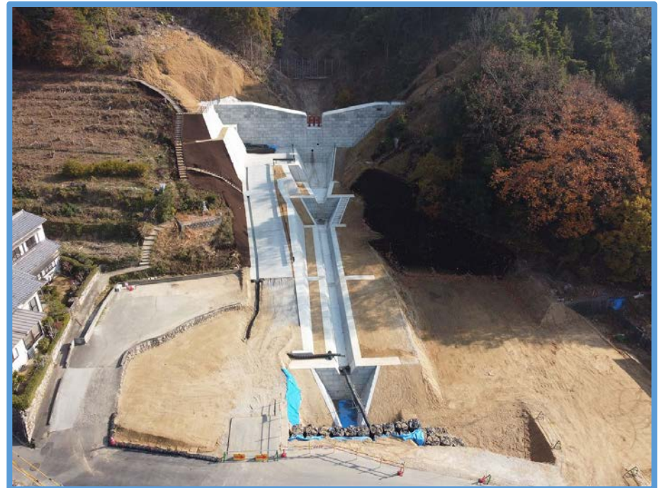
側壁工の施工状況