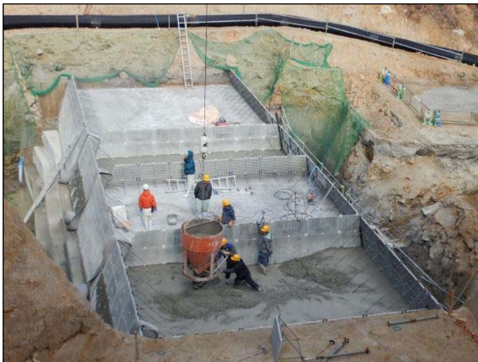
コンクリート打設状況①