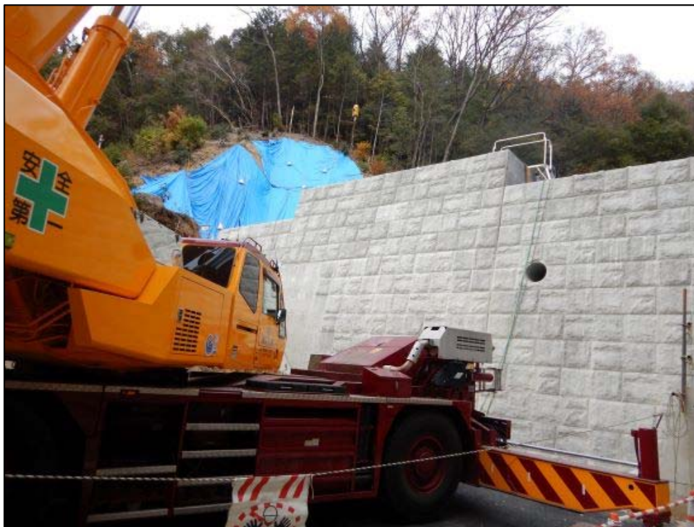
コンクリート打設状況①