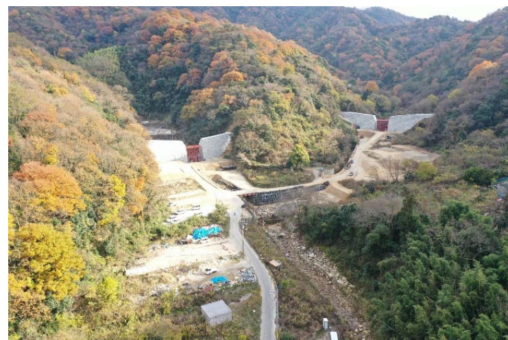
総頭川・大判川施工状況 (R2.12時点)