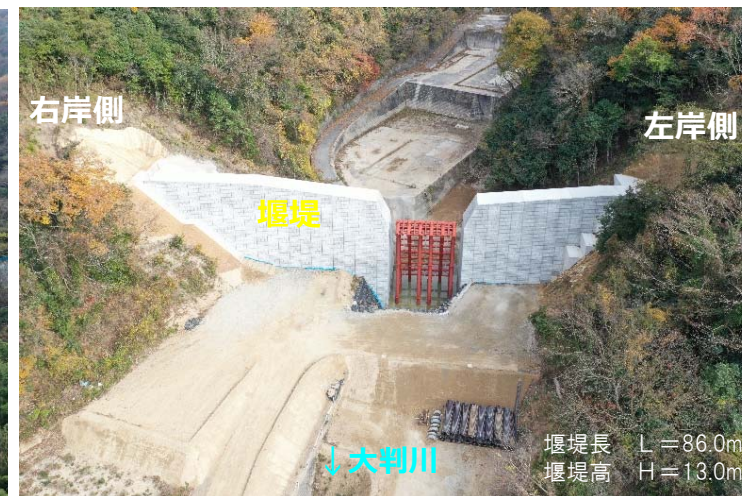
大判川施工状況（下流側より）