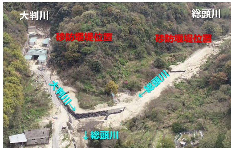
総頭川・大判川施工状況 (着手前H31.4時点)