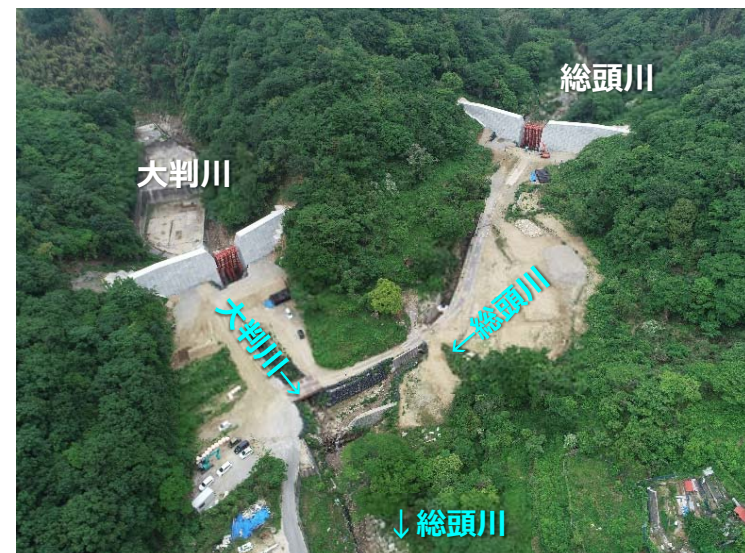
総頭川・大判川施工状況 (R2.12時点)