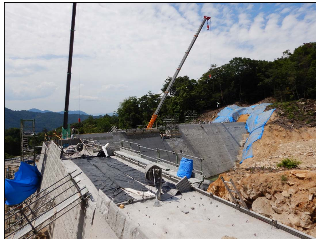
砂防堰堤施工状況②