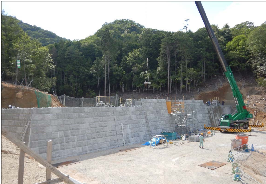
砂防堰堤施工状況①