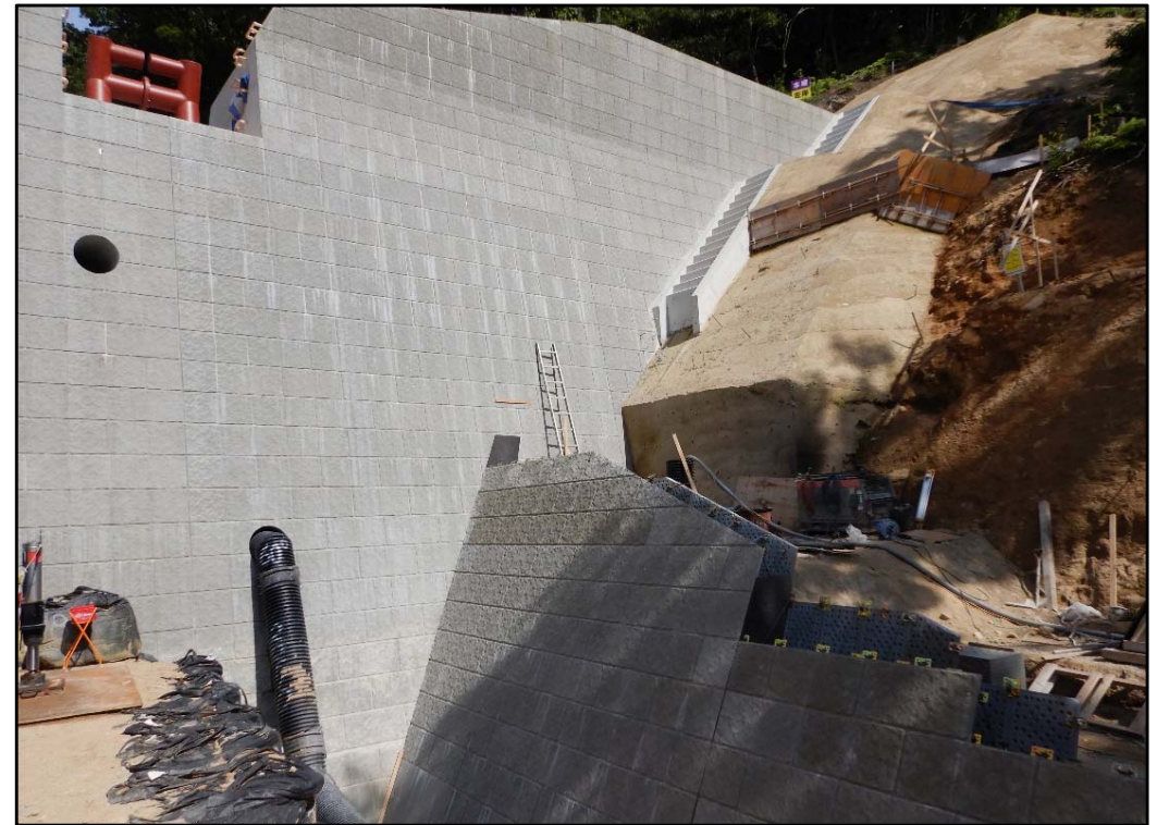
前庭保護工施工状況