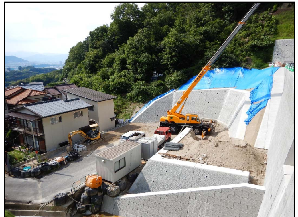
管理用道路施工状況