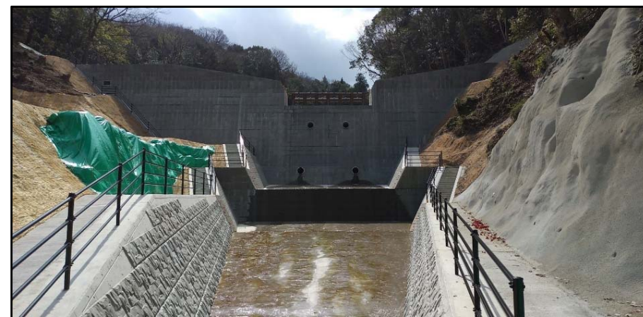
前庭保護工、溪流保全工