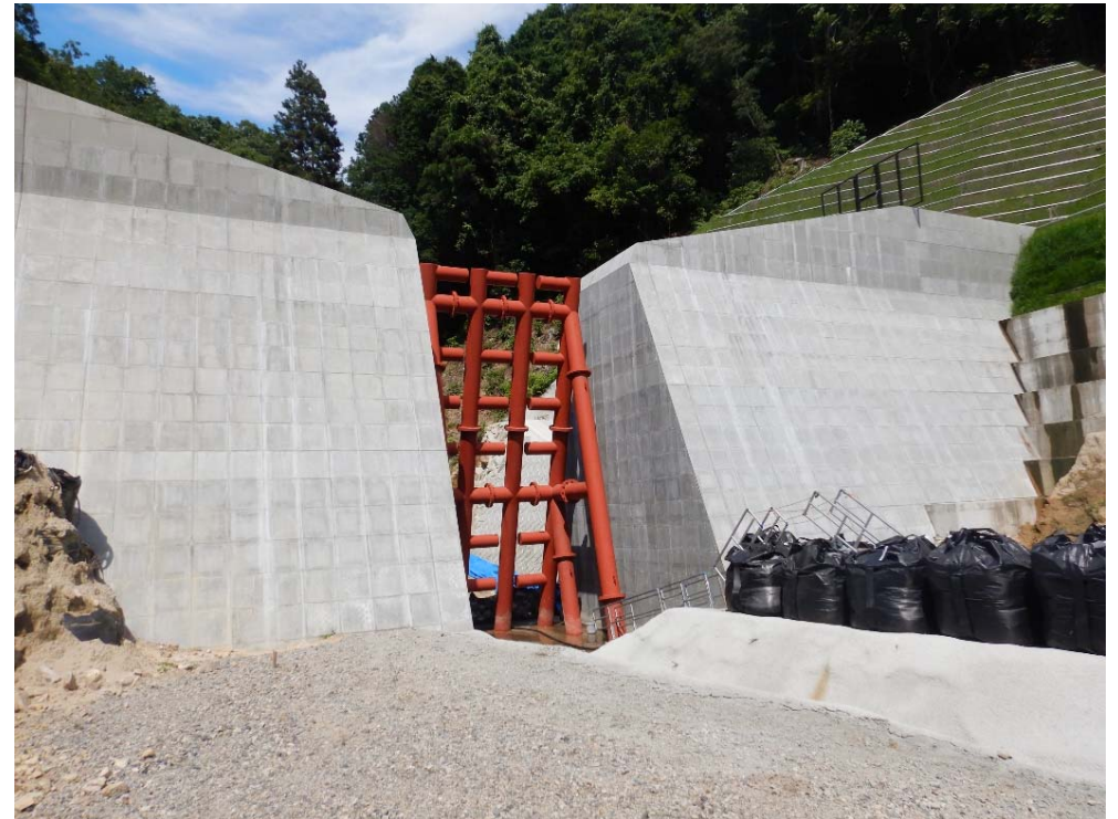
砂防堰堤下流側より