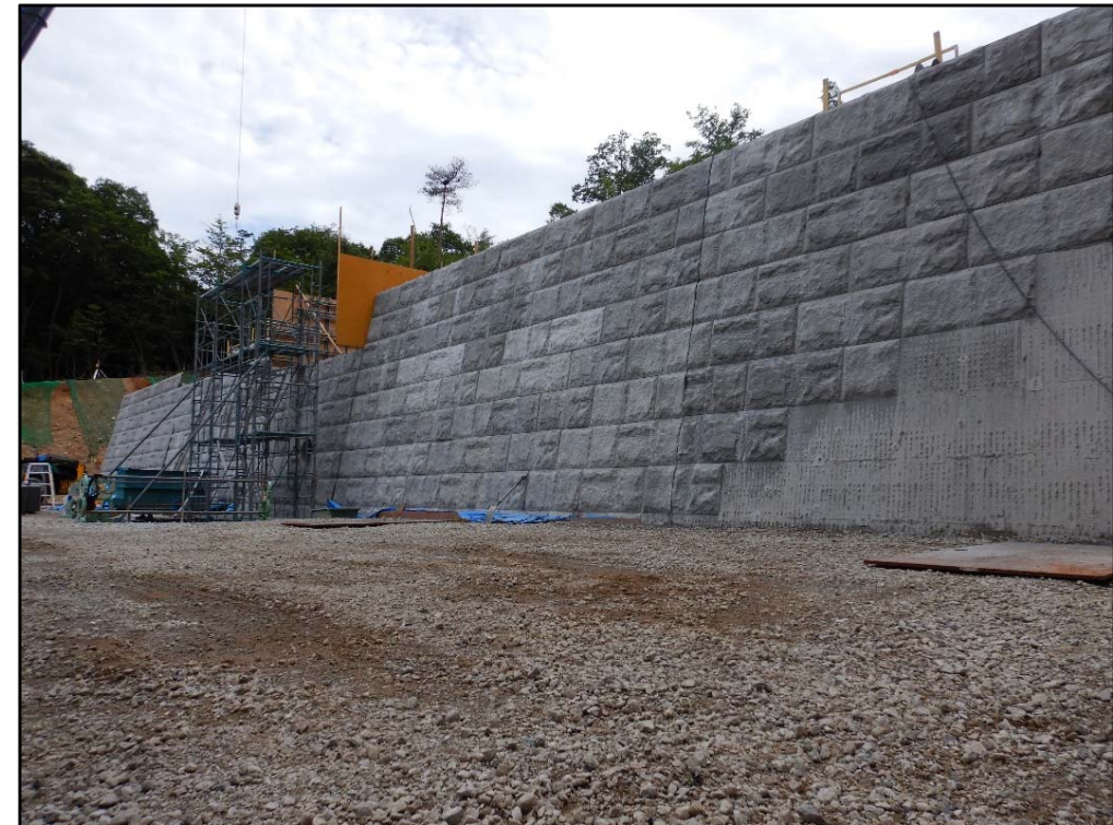
砂防堰堤施工状況②