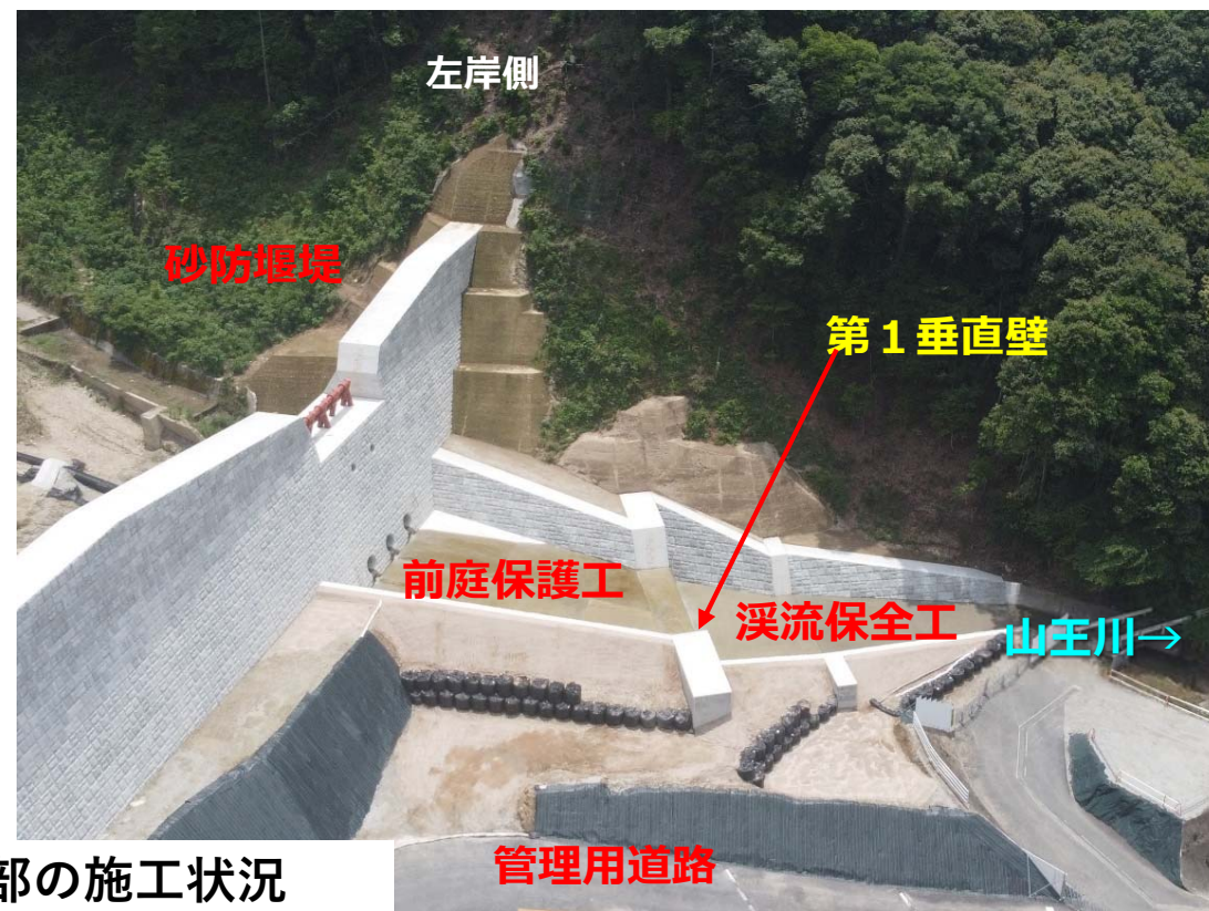
砂防堰堤下流部の施工状況