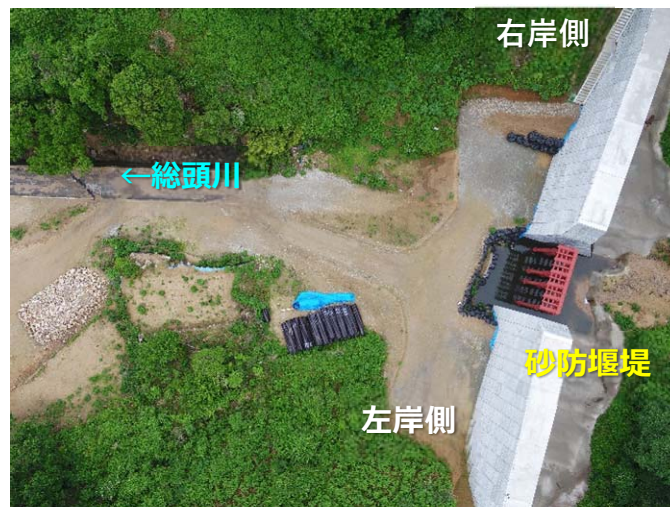
総頭川施工状況（空撮）