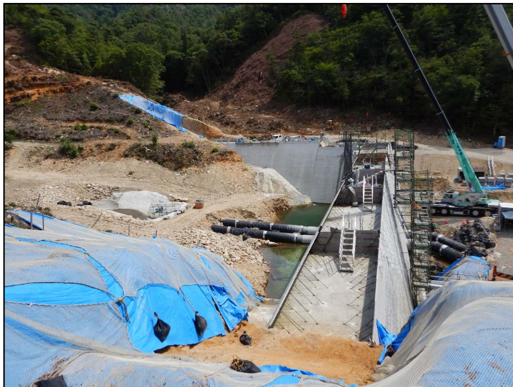
砂防堰堤施工状況①