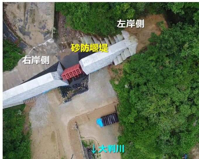
大判川施工状況（空撮）