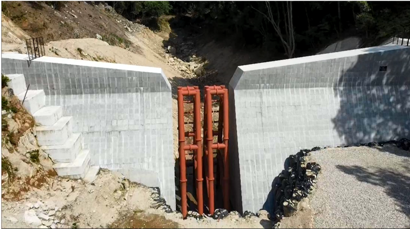
砂防堰堤本体全景