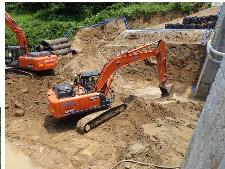
前庭保護工掘削状況（総頭川）