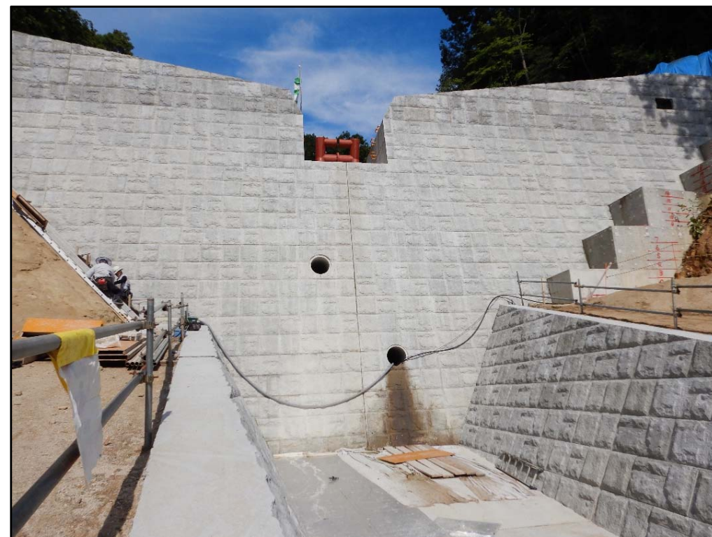
前庭保護工・階段工施工状況