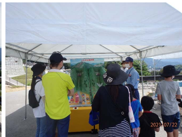
土石流模型実験装置 説明状況