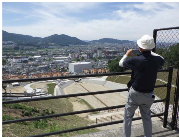
砂防堰堤（ダム）天端 見学状況