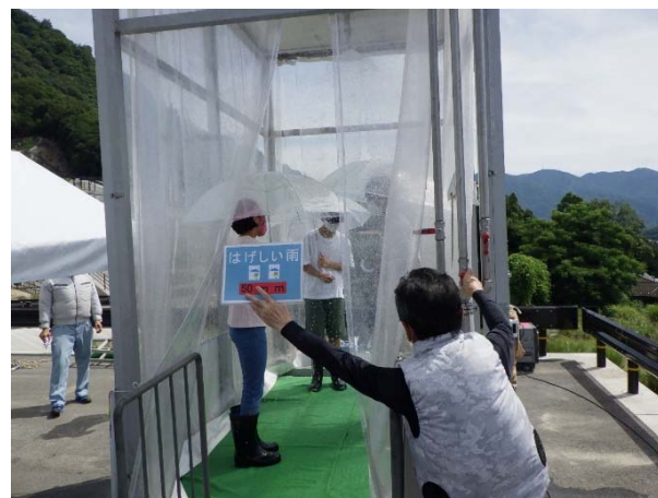
降雨体験機による「豪雨体験」状況