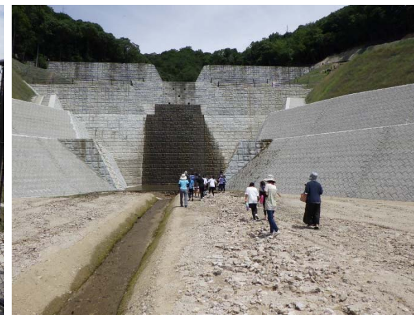
堆積工（たいせきこう）見学状況