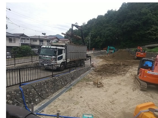
【ダンプによる流木の搬出】