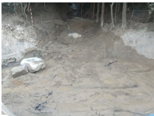
【谷出口部の掘削状況】