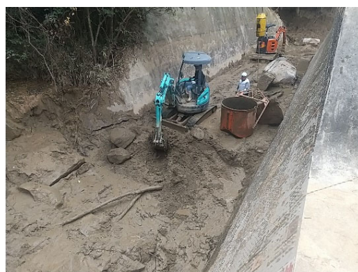
【土砂を掘削しホッパーへの積み込み状況】