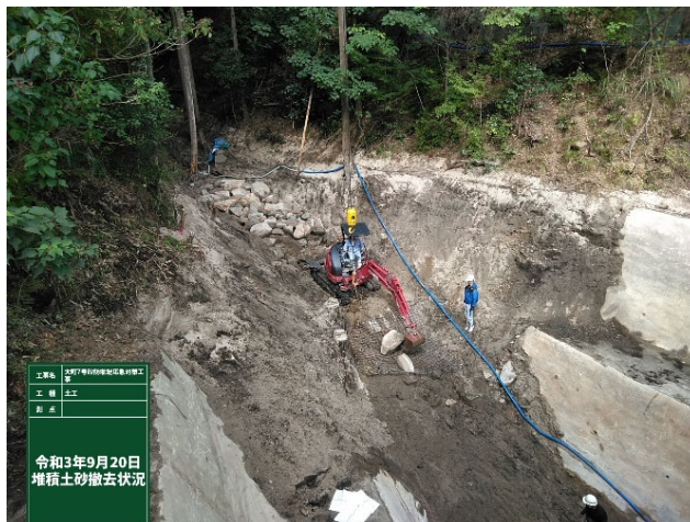
【巨石集積・積み込み状況】