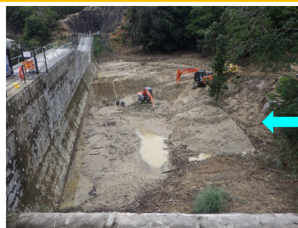
現在の状況（R3. 9. 15撮影）