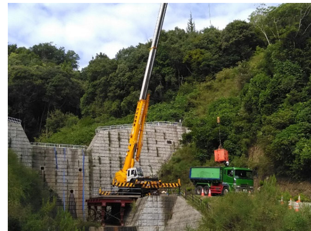
【クレーンによる搬出状況】