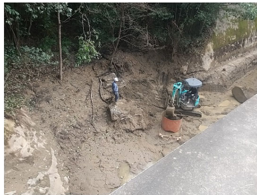
【ホッパーへの積込状況】