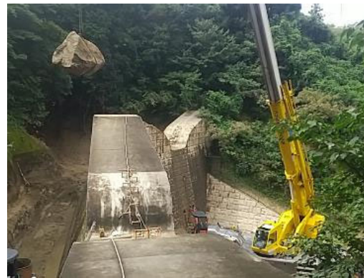
【クレーンによる巨石の搬出状況】