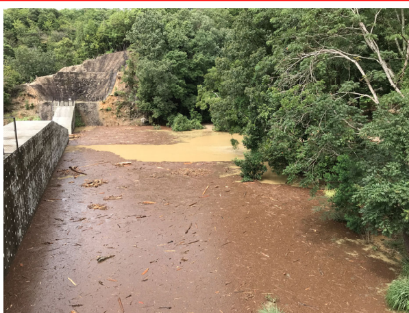
土石流発生直後（R3. 8. 15撮影）