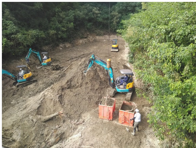
【ホッパー積み込み状況】