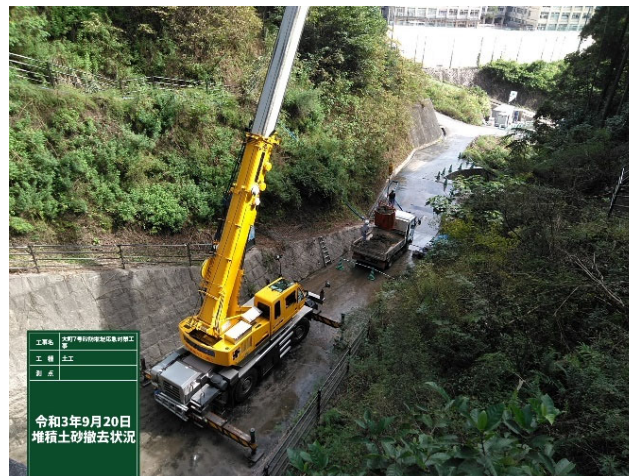
【クレーンによる搬出状況】