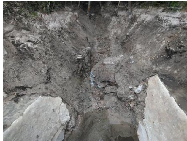
【堰堤上流側の撤去状況】