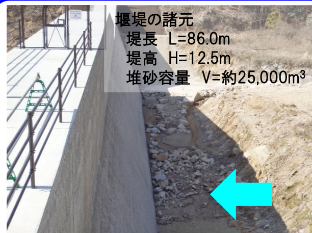
土石流発生前（H29. 3. 9撮影）