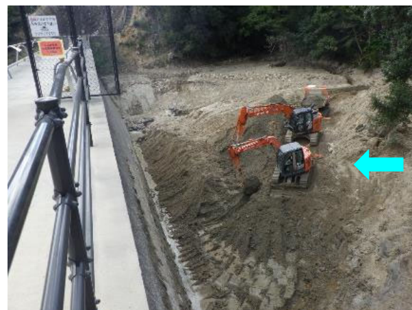
現在の状況（R3. 9. 27撮影）