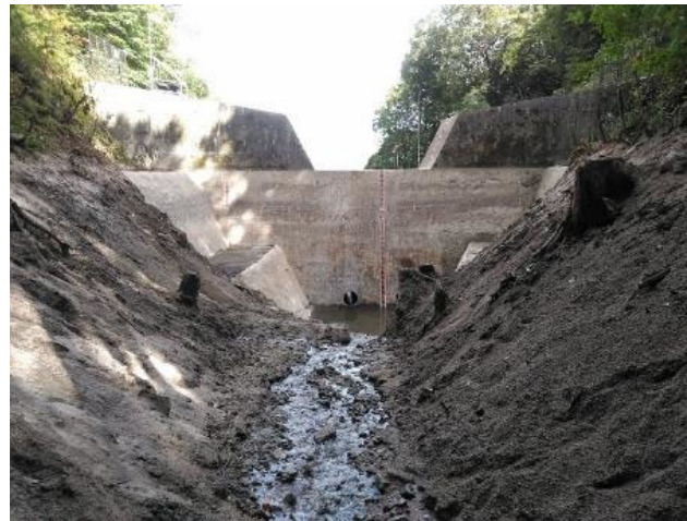
【堰堤上流側の撤去状況】