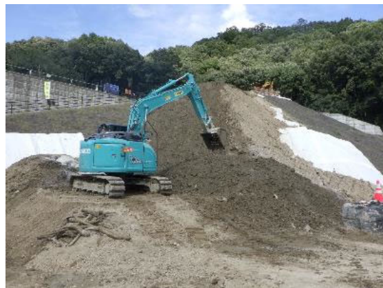
【堰堤から落とした土砂の集積・ダンプ搬出状況】