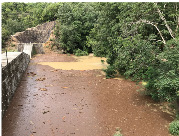
土石流発生直後（R3. 8. 15撮影）