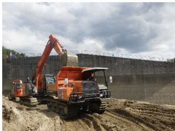
【掘削土砂の積込状況】