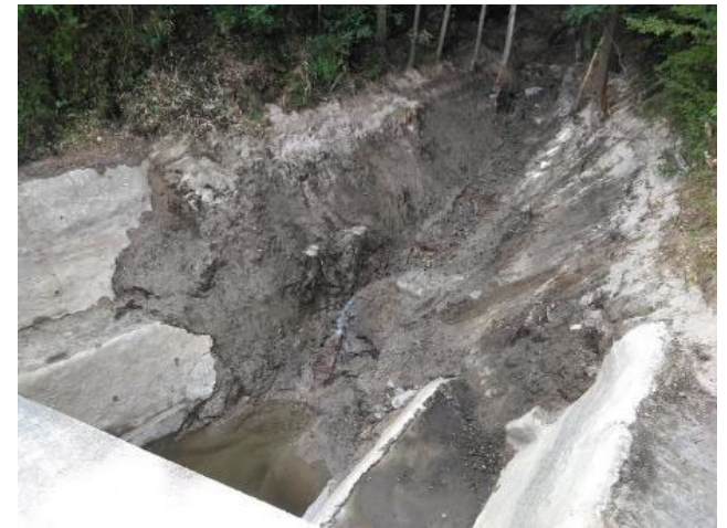
【堰堤上流側の撤去状況】