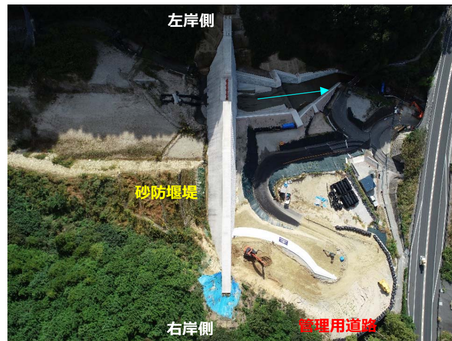
管理用道路の施工状況