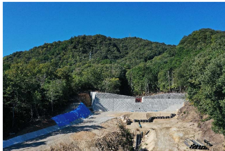
砂防堰堤施工状況②