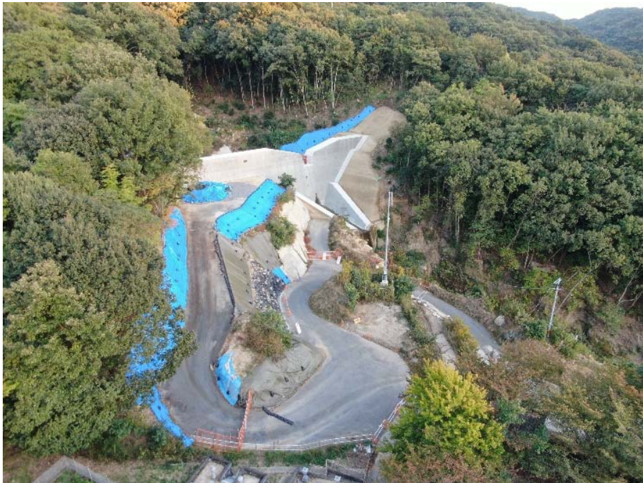
砂防堰堤全景（下流側より）