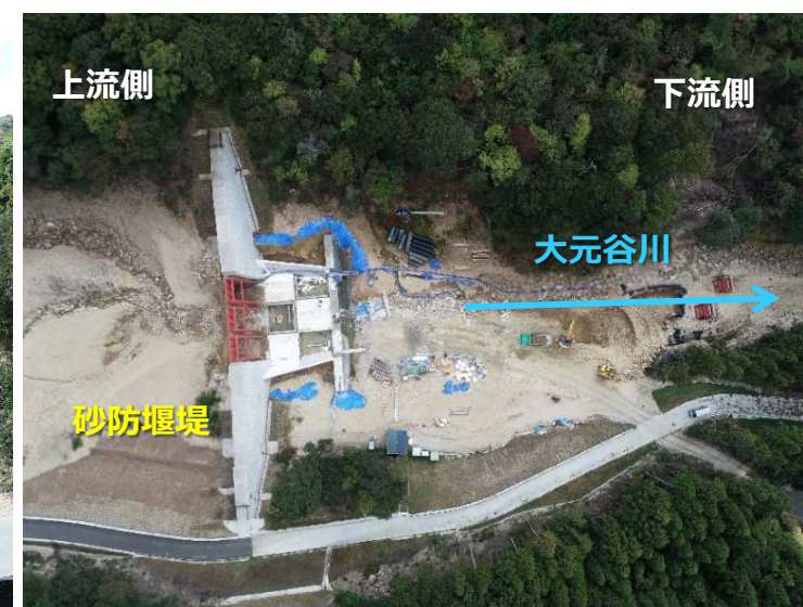
砂防堰堤全景（下流側より）