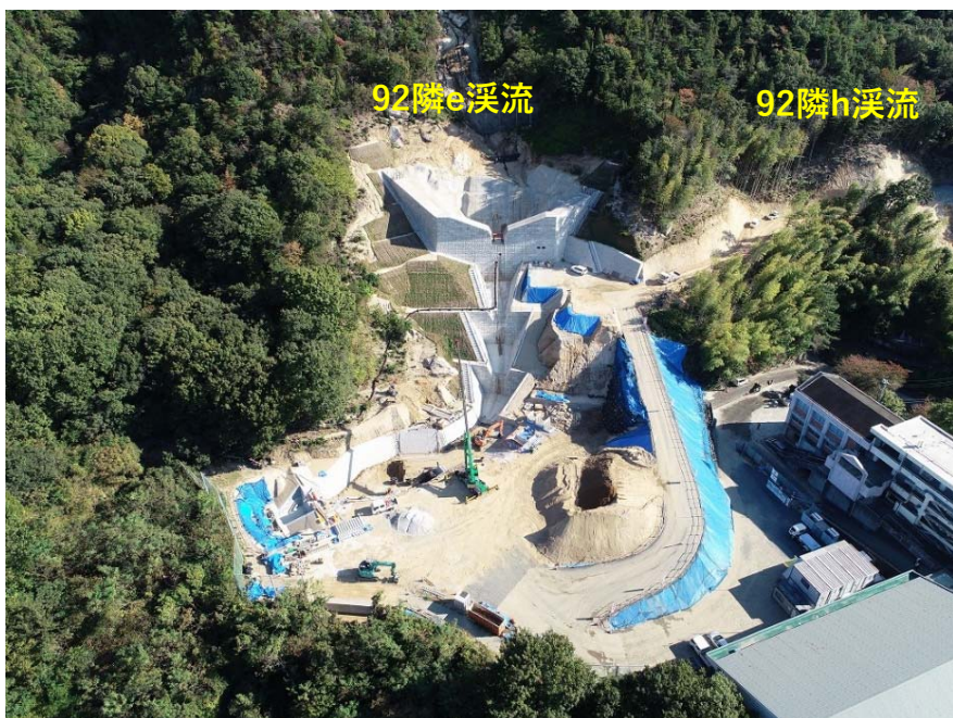
92隣e、92隣h溪流 全景（R3.10月末時点）