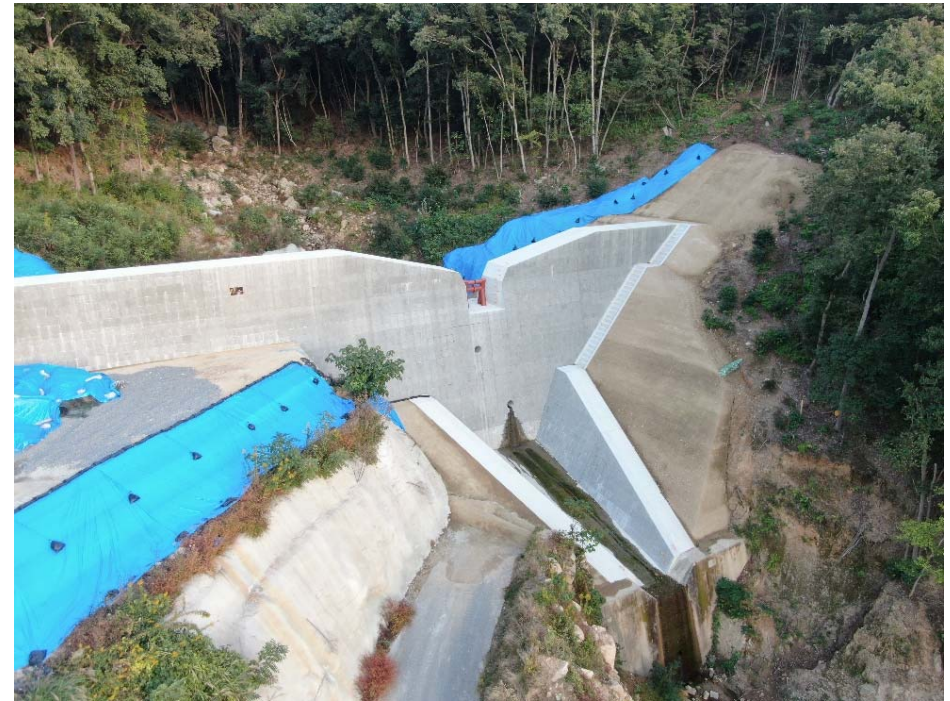
砂防堰堤（下流側より）