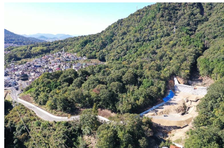
砂防堰堤施工状況①