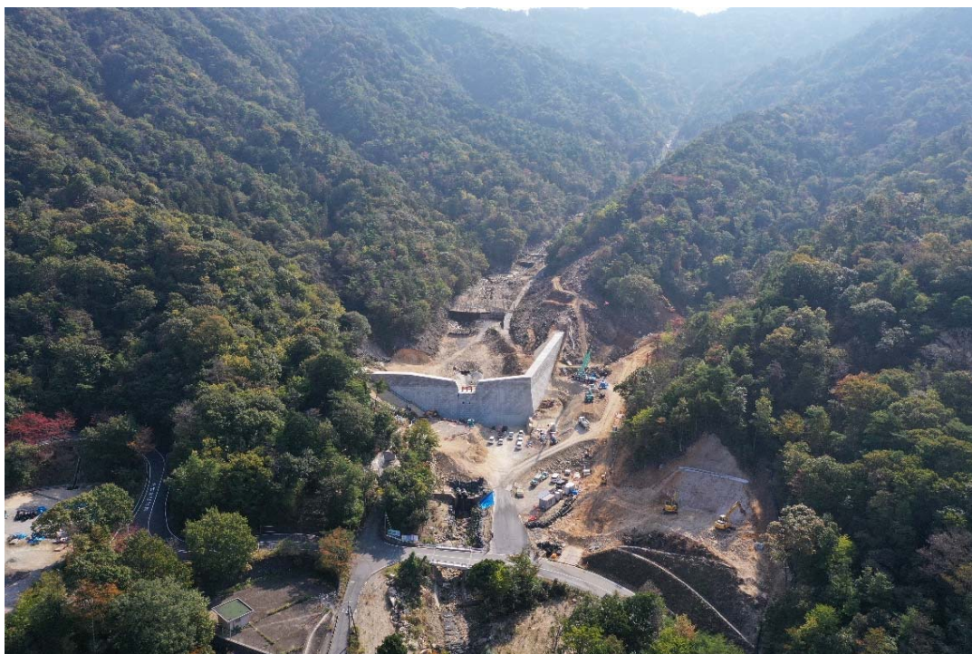
砂防堰堤施工状況（全景）