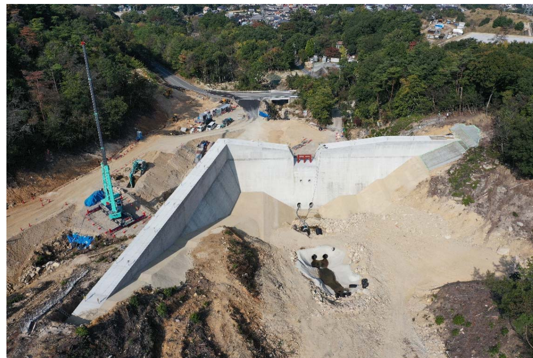
砂防堰堤施工状況（上流側より）