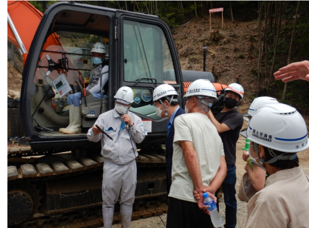
ICT建機のモニター画面の説明