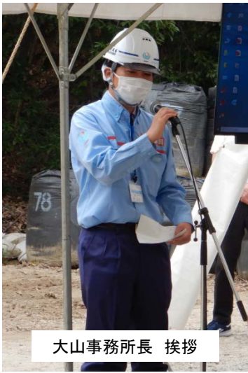
大山事務所長 挨拶