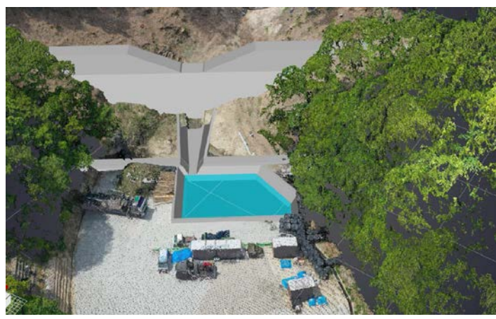
3次元データを使った砂防堰堤の完成イメージ