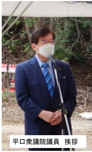
平口衆議院議員 挨拶