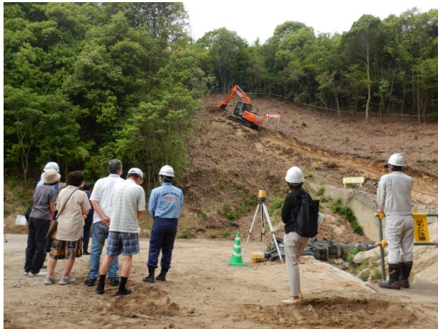
ICT建機によるデモンストレーション