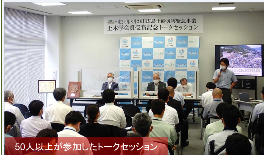
50人以上が参加したトークセッション