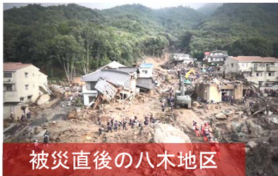
被災直後の八木地区