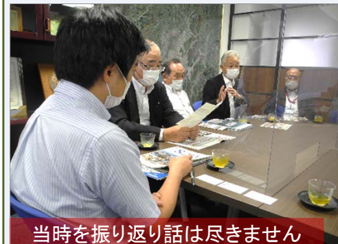
当時を振り返り話は尽きません