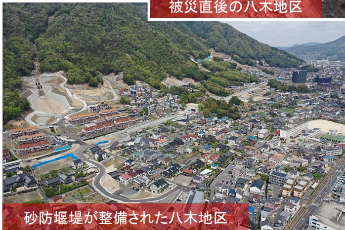
砂防堰堤が整備された八木地区