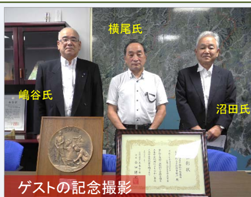
ゲストの記念撮影