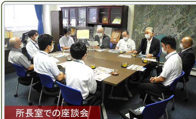
所長室での座談会