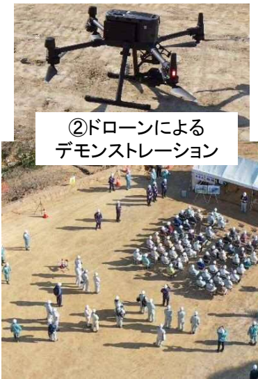
②ドローンによる デモンストレーション