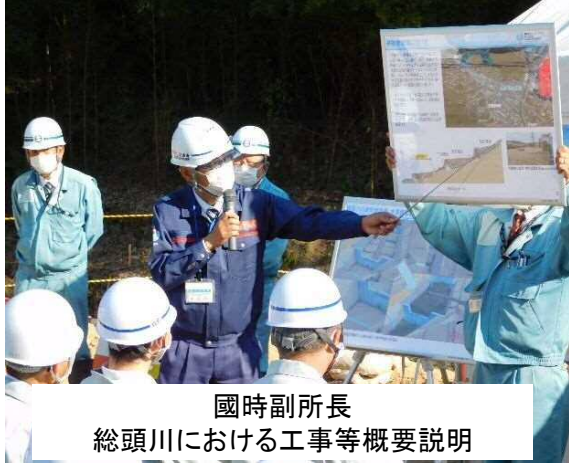
國時副所長 総頭川における工事等概要説明