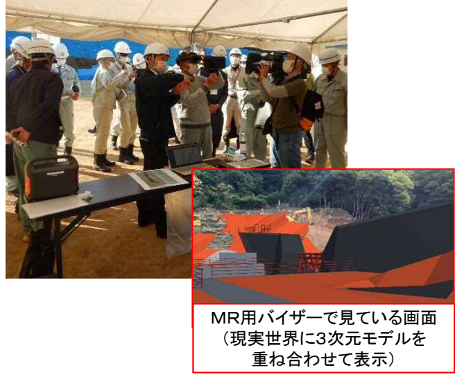
MR用バイザーで 見ている画面 (現実世界に3次元モデルを 重ね合わせて表示)