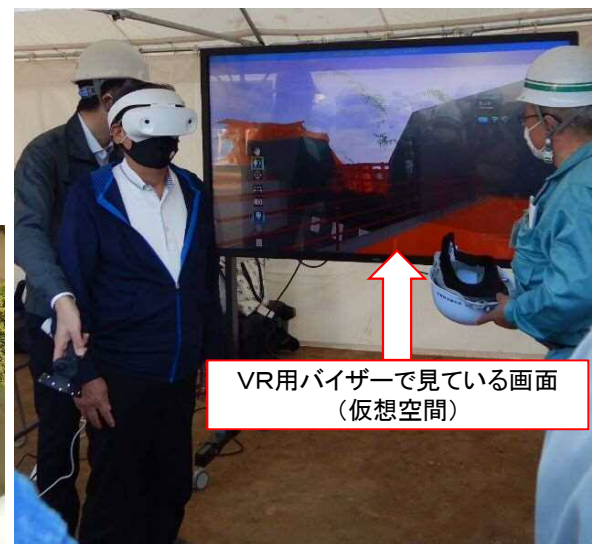
VR用バイザーで 見ている画面 (仮想空間)