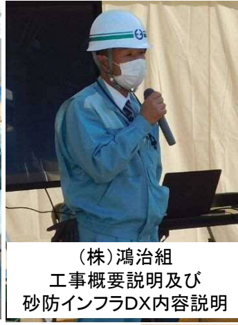
(株)鴻治組 工事概要説明及び 砂防インフラDX内容説明