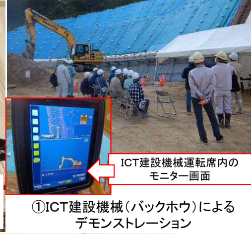
ICT建設機械運転席内の モニター画面