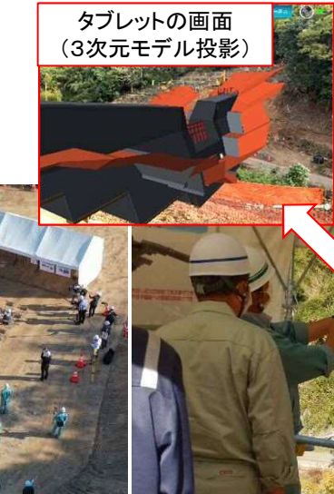
タブレットの画面 (3次元モデル投影)