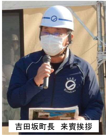
吉田坂町長 来賓挨拶