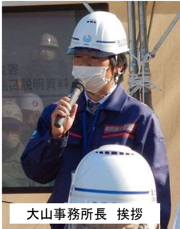
大山事務所長 挨拶

地元の方々からは、新技術を利用して砂防堰堤の早期完成を期待する声が聞かれました。