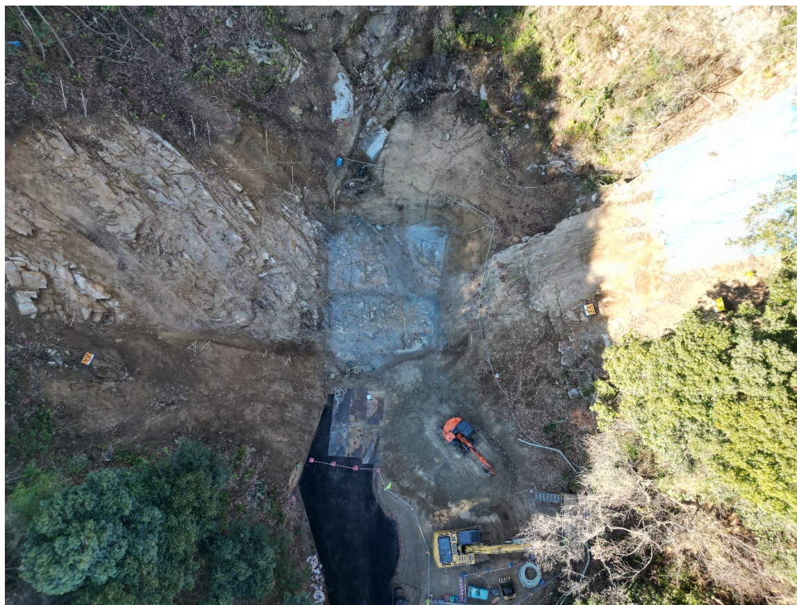
【施工状況（上空より）】