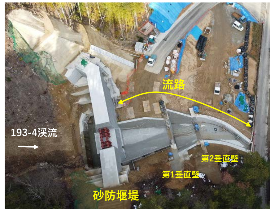
【施工状況(砂防堰堤、第1、2垂直壁)】