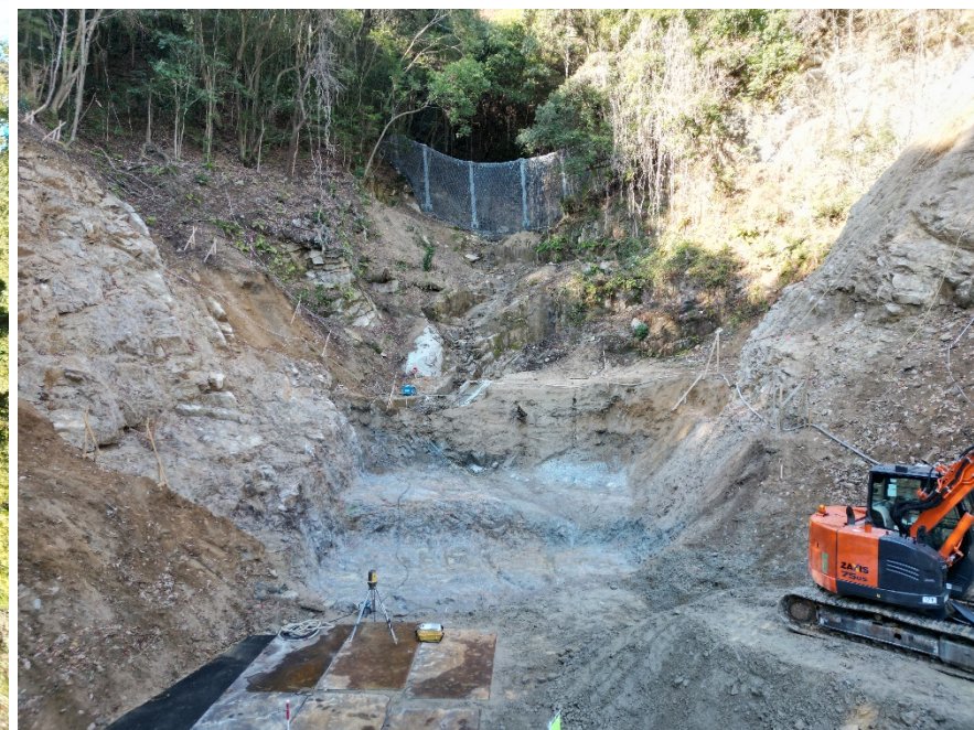
【施工箇所（下流側より）】