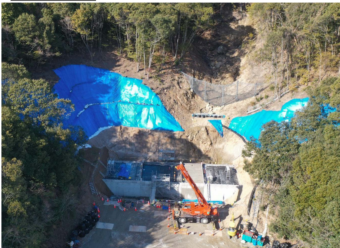
【施工状況（下流側より）】