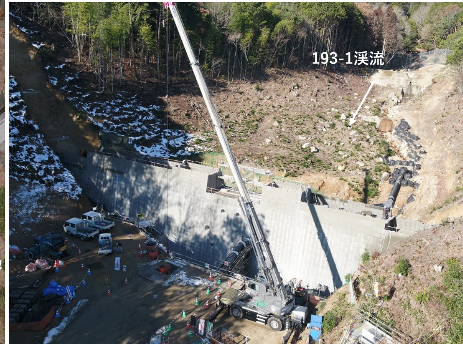
【施工状況 (砂防堰堤)】