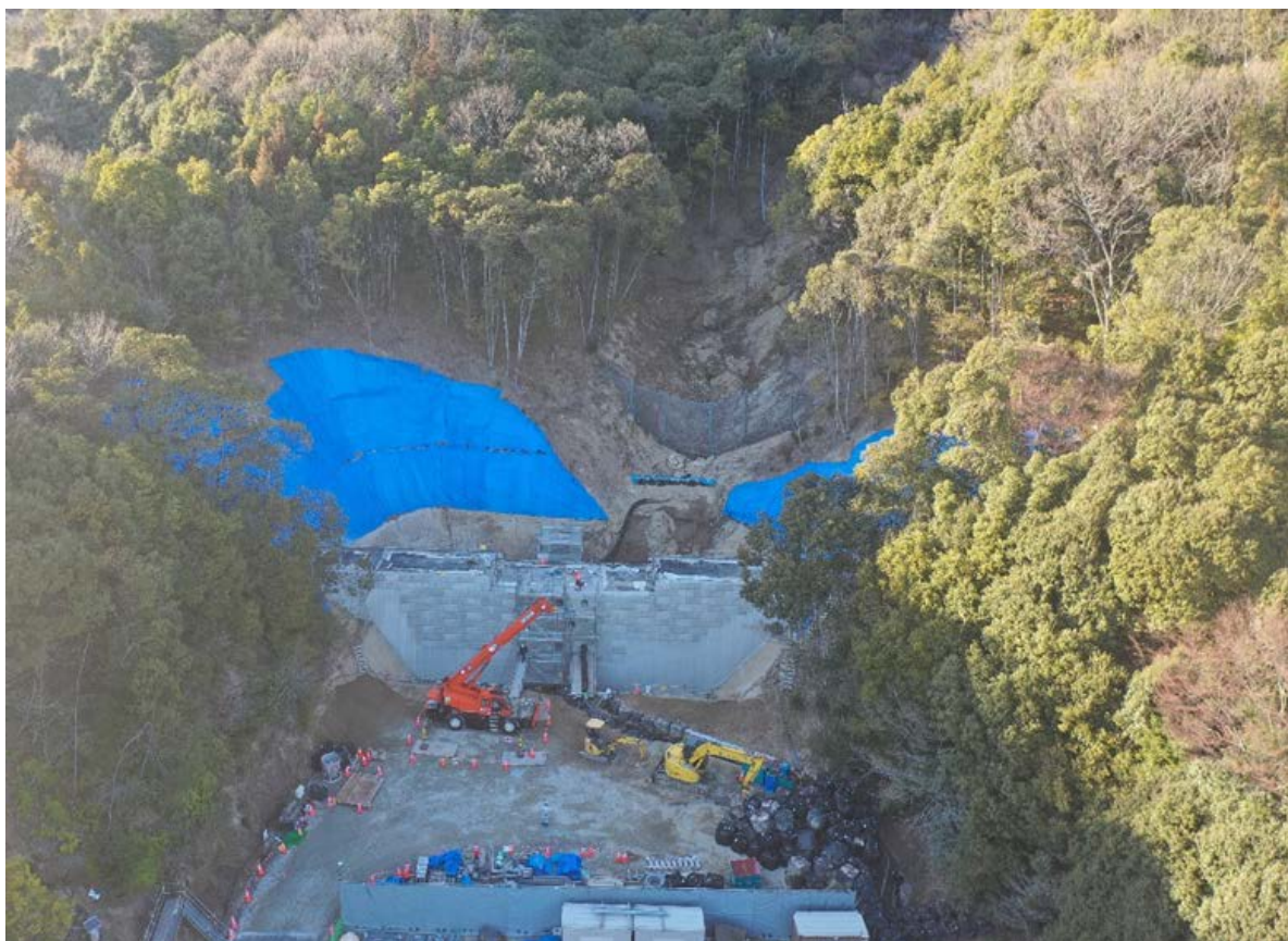
【施工状況（下流側より）】