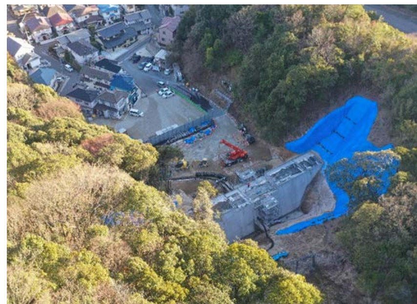
【施工状況（上流側より）】