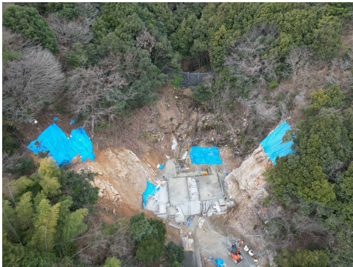
【施工状況（上空より）】