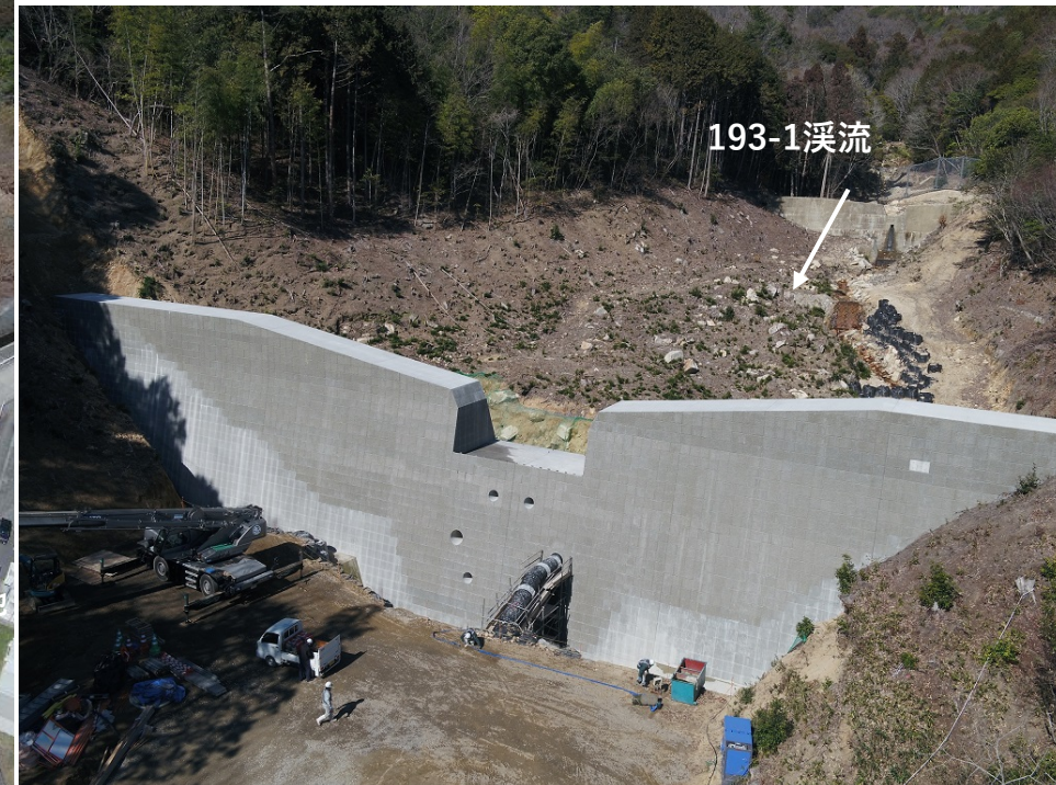
【施工状況(砂防堰堤)】