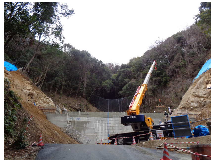
【施工箇所（下流側より）】