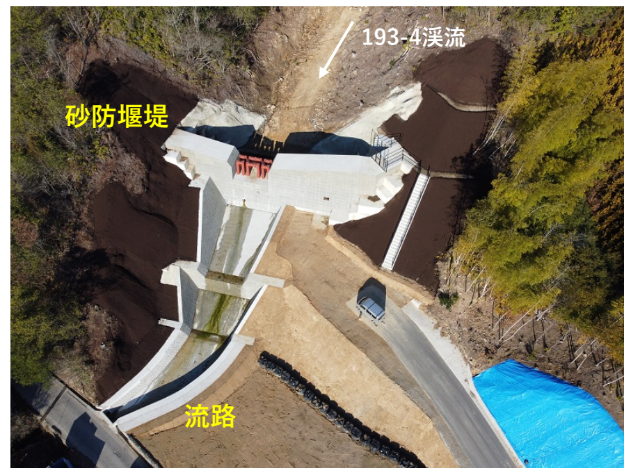
【施工状況(砂防堰堤、流路)】