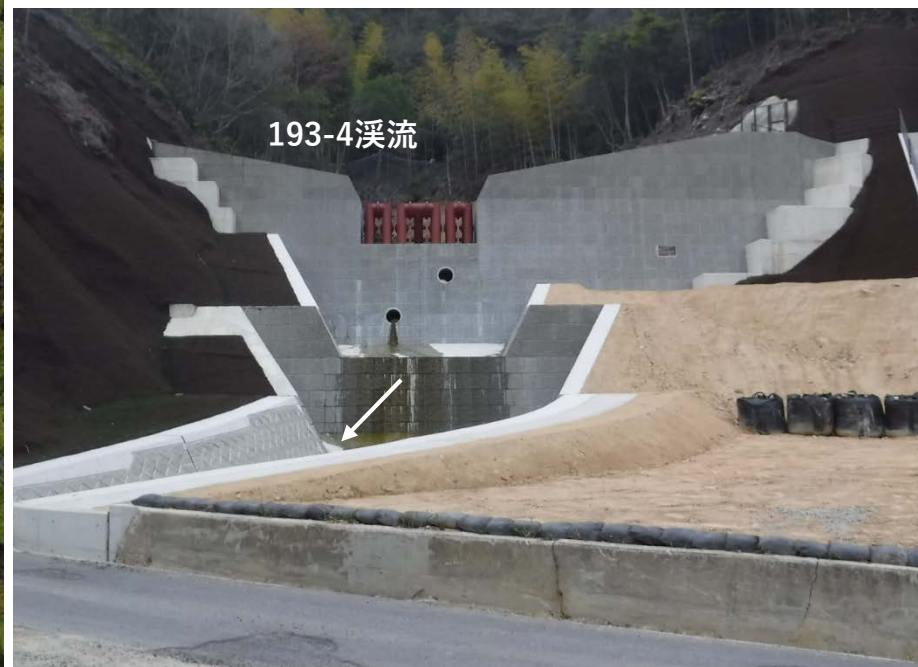
【施工状況（砂防堰堤、流路）】