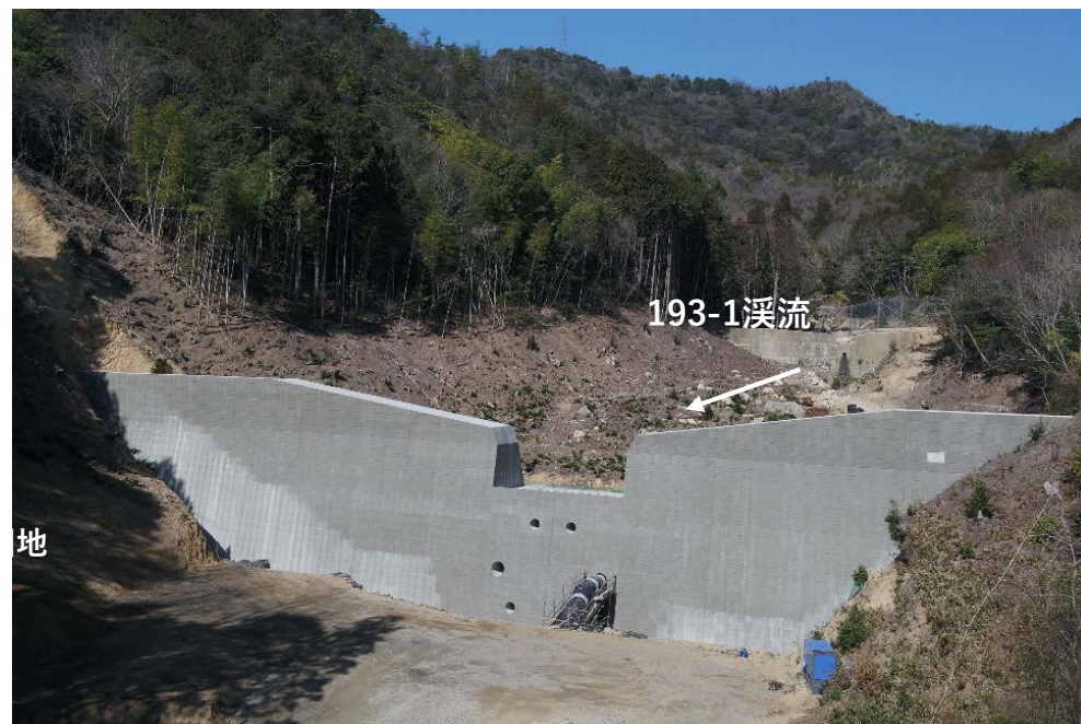
【完成状況（砂防堰堤）】