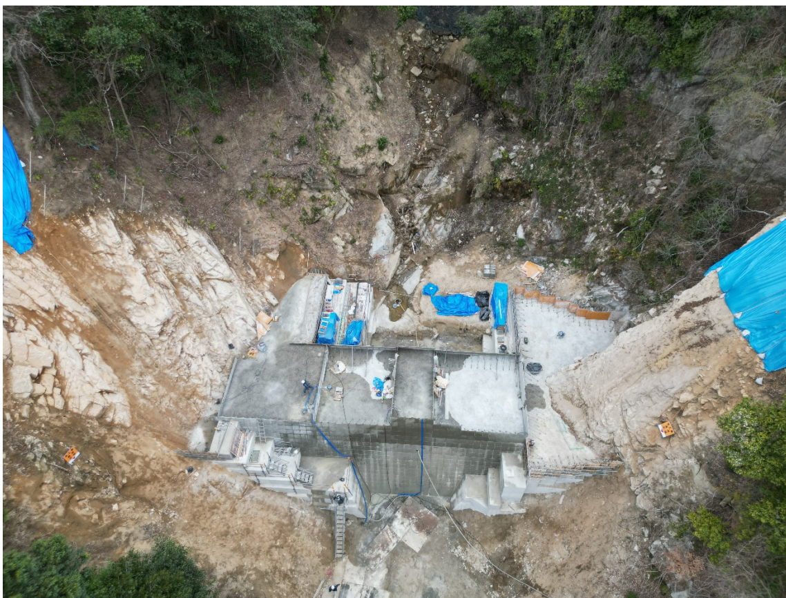
【施工状況（上空より）】