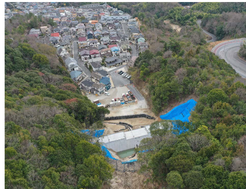
【施工状況（上流側より）】