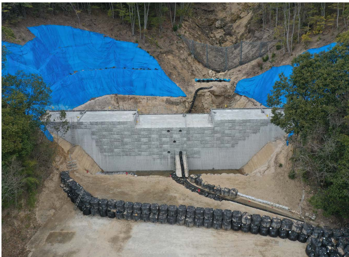
【施工状況（下流側より）】