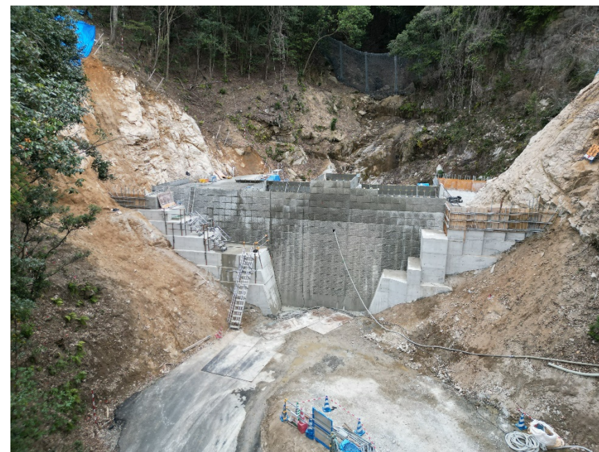
【施工箇所（下流側より）】