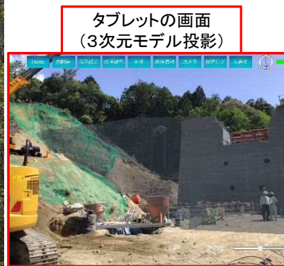
タブレットの画面 (3次元モデル投影)