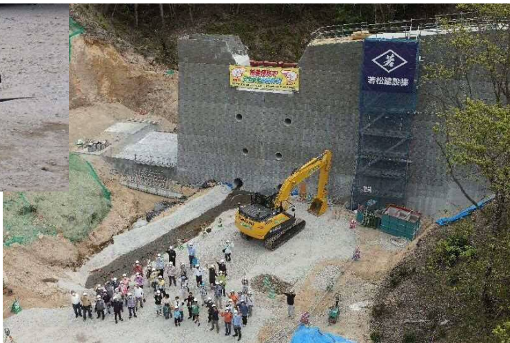
ドローンによる上空から撮影した会場状況