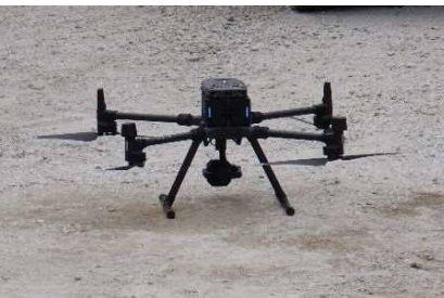
②ドローンによるデモンストレーション