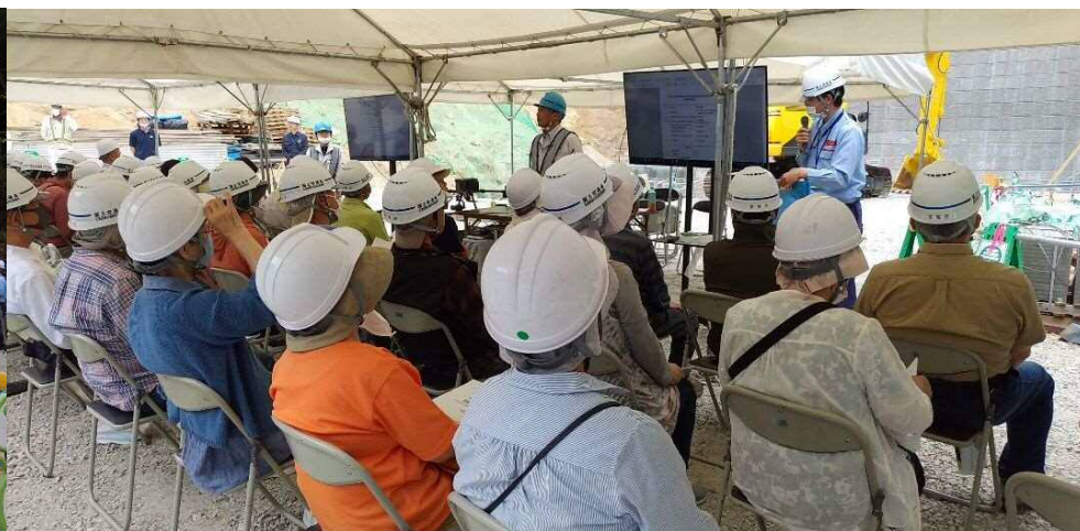
見学会の説明状況