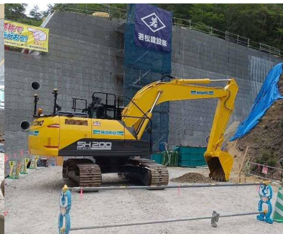
①ICT建設機械(バックホウ)によるデモンストレーション