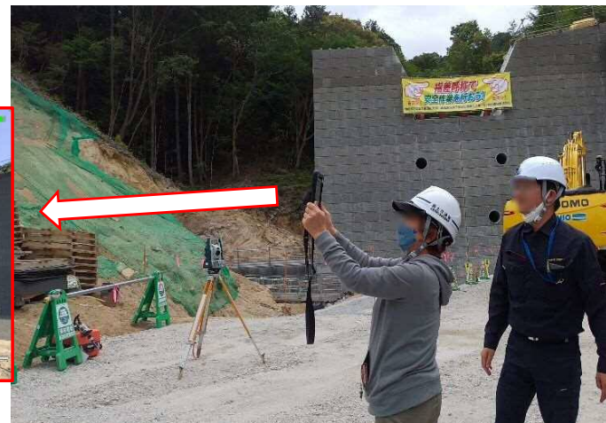
③タブレットによるAR技術の体験