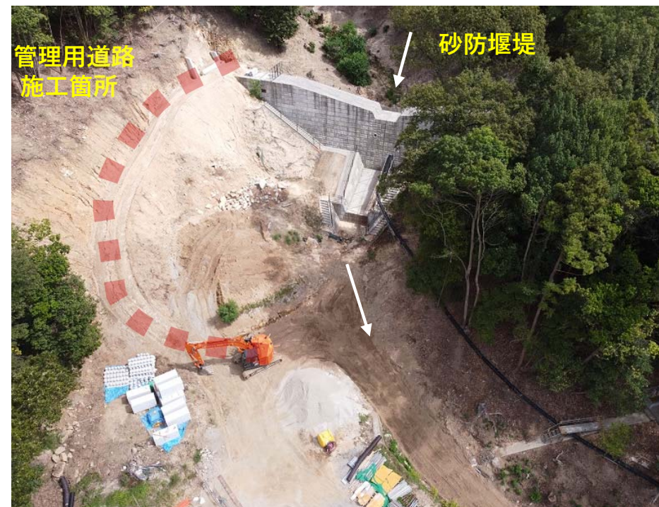
【管理用道路 施工状況】