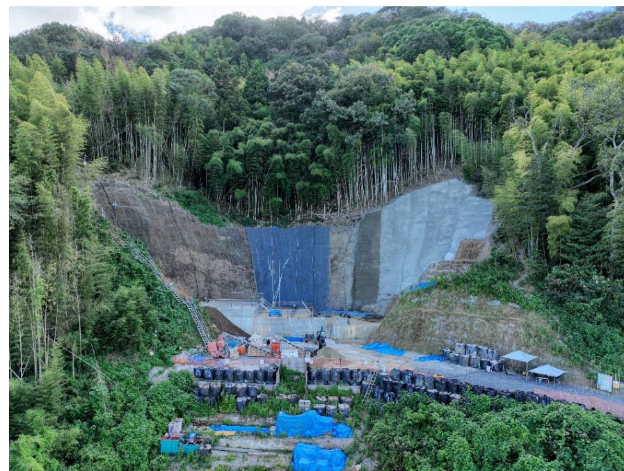
【施工状況（下流側より）】