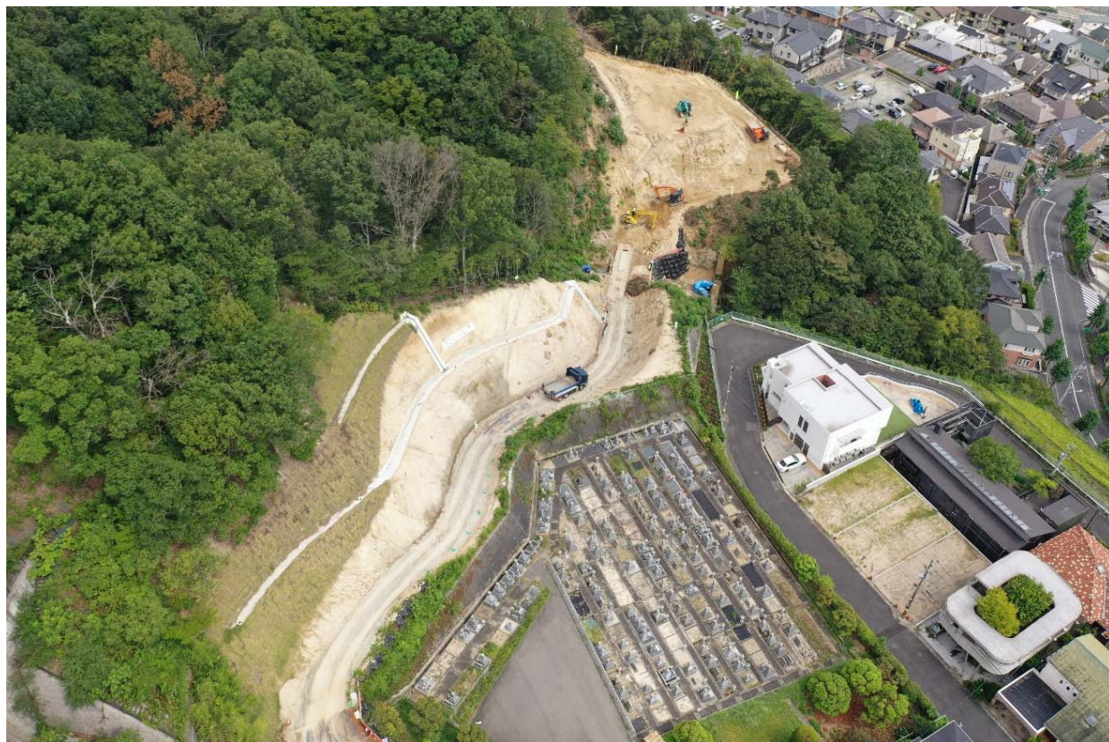
【全 景 (起点側より)】