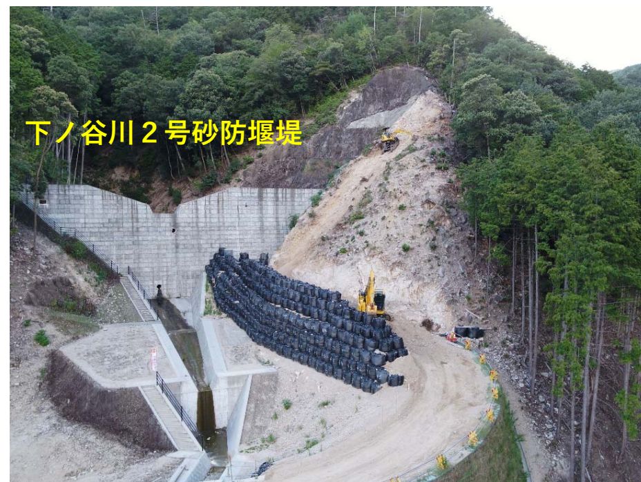
【管理用道路（下流）箇所】