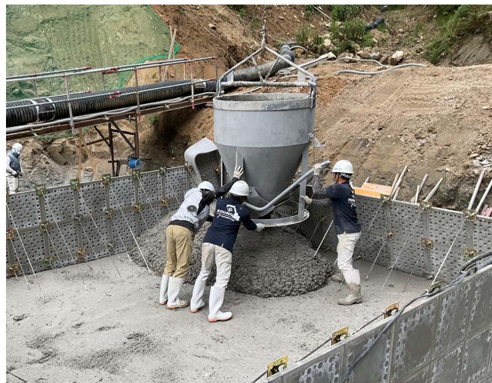
【砂防堰堤工施工状況】