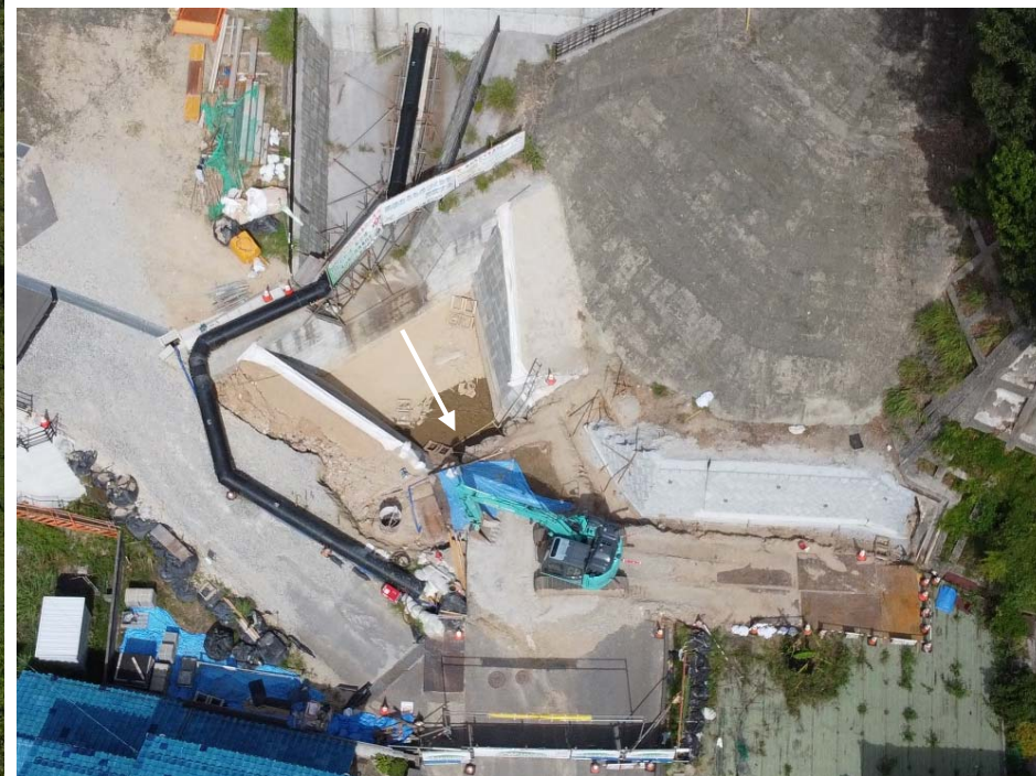
【 施工状況 (流路：ブロック積、埋戻し) 】