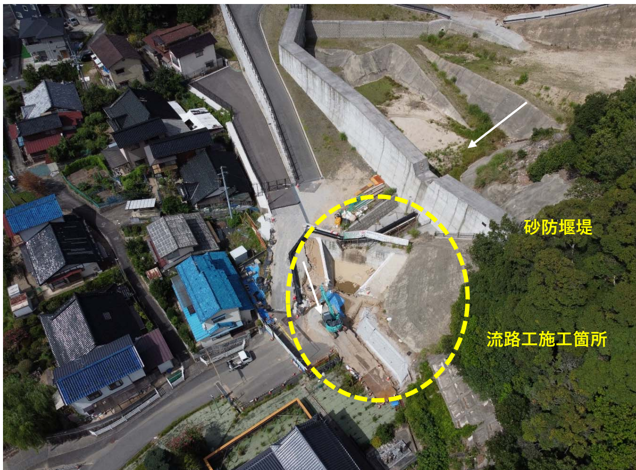
【 全 景 】