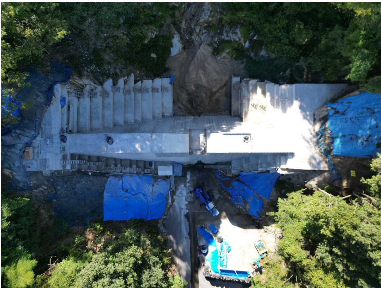
【施工状況(上空より)】