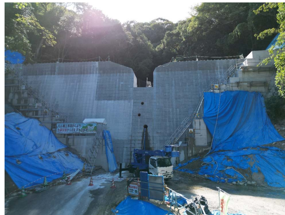
【施工箇所(下流側より)】