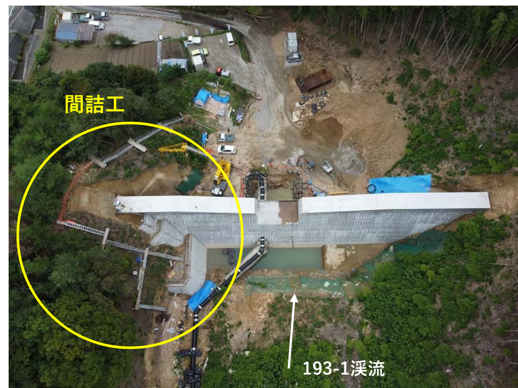
【堰堤上流側の状況】