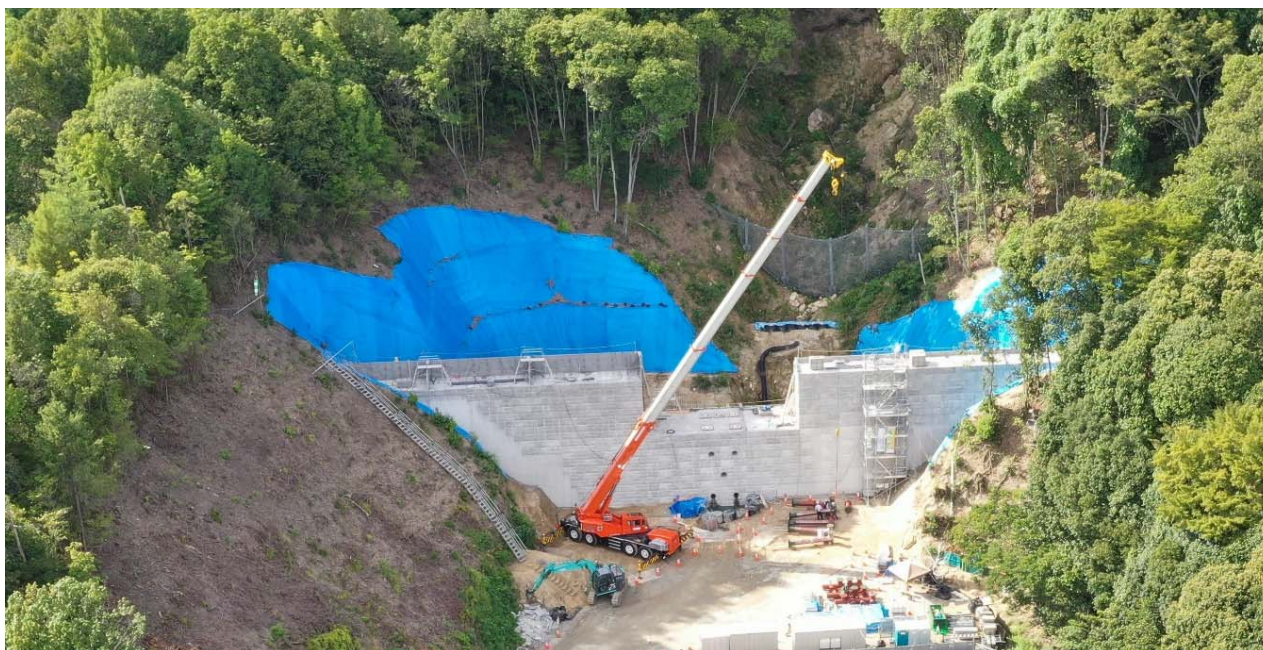
【施工状況（下流側より）】