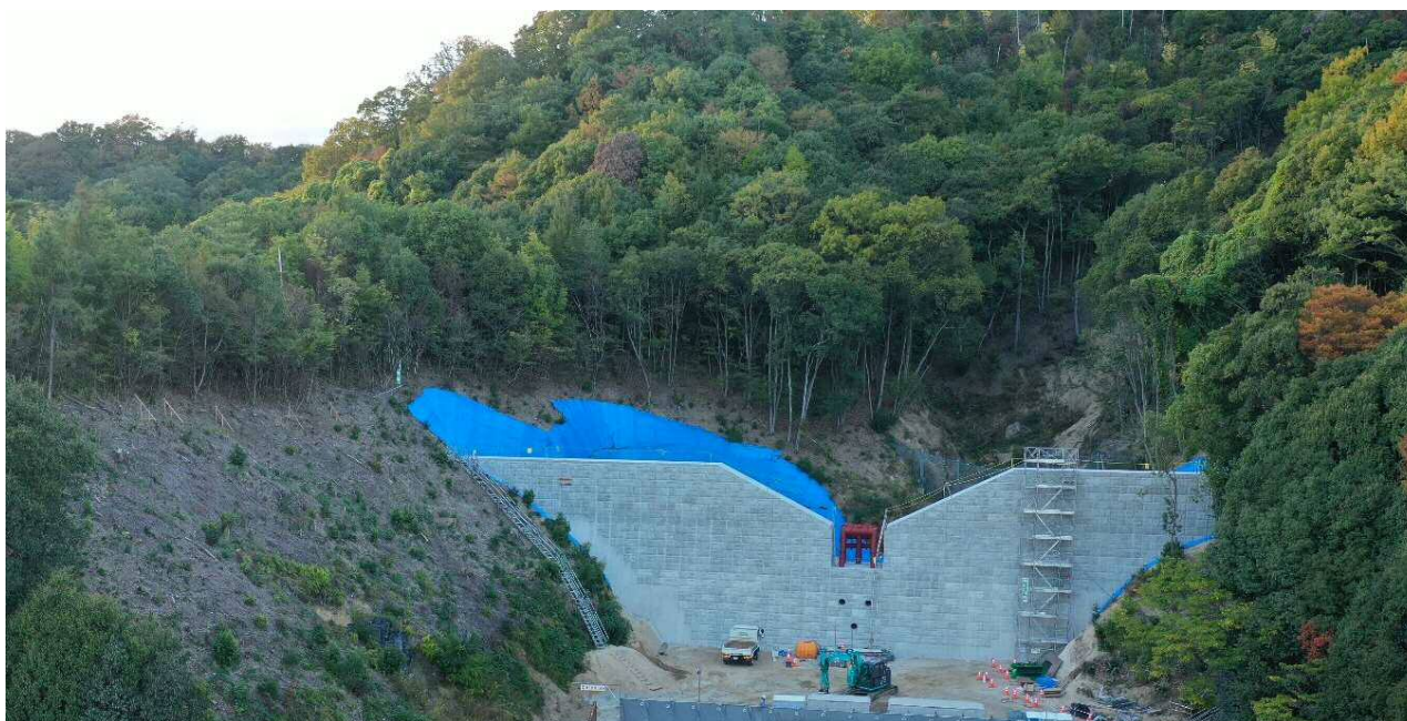
【施工状況（下流側より）】