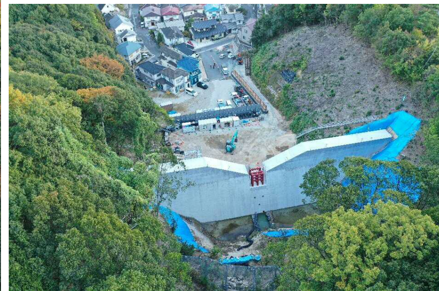
【施工状況（上流側より）】