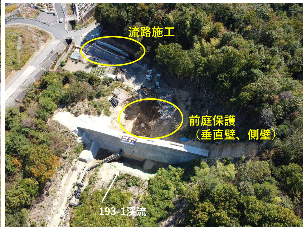
【砂防堰堤及び流路の施工状況】