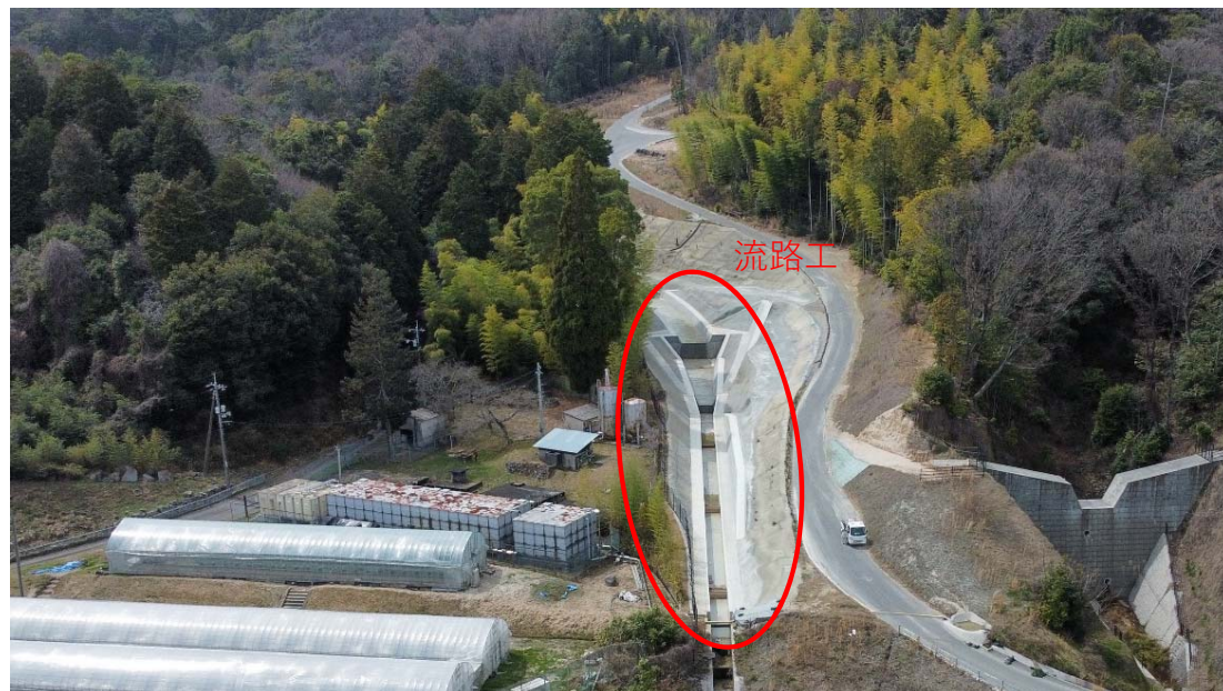
【全 景 (下流側)】