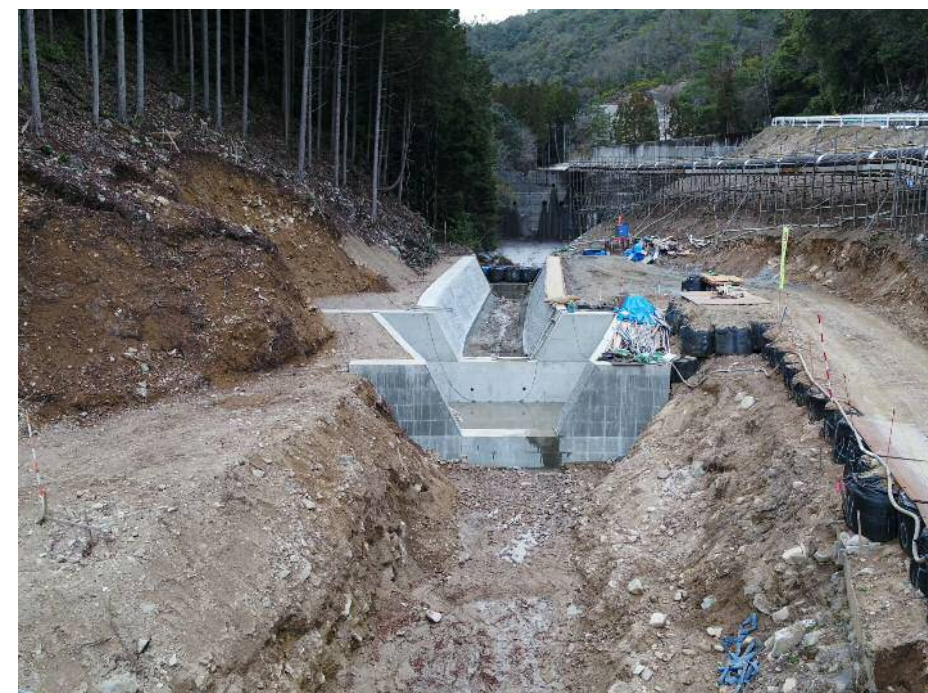
【580溪流 流路工施工状況】