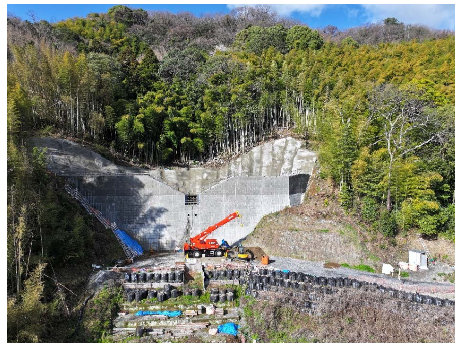
【施工状況（下流側より）】