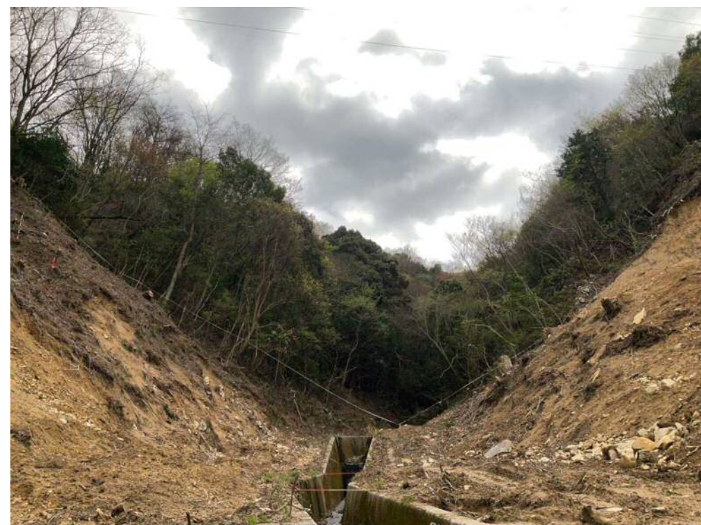
【施工状況（下流側より）】