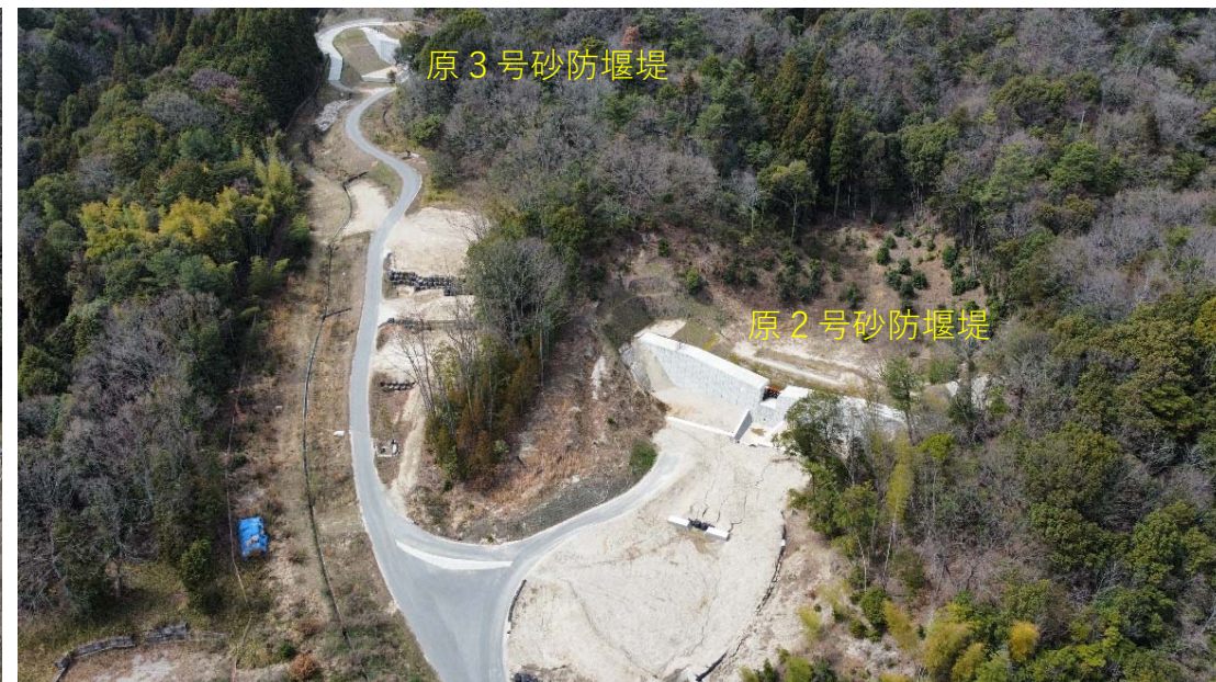
【全 景 (上流側)】