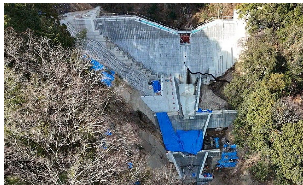
【施工状況（下流上空より）】