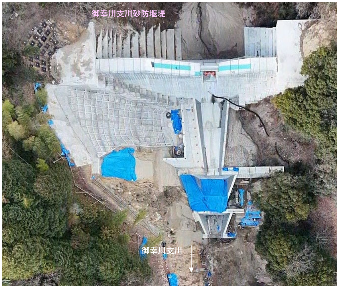
【施工状況（上空より）】