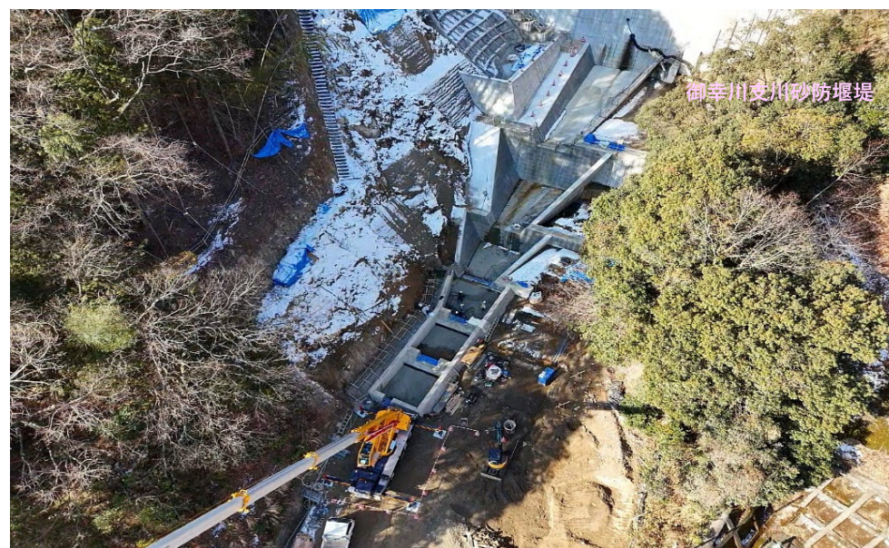
【施工状況（下流上空より）】