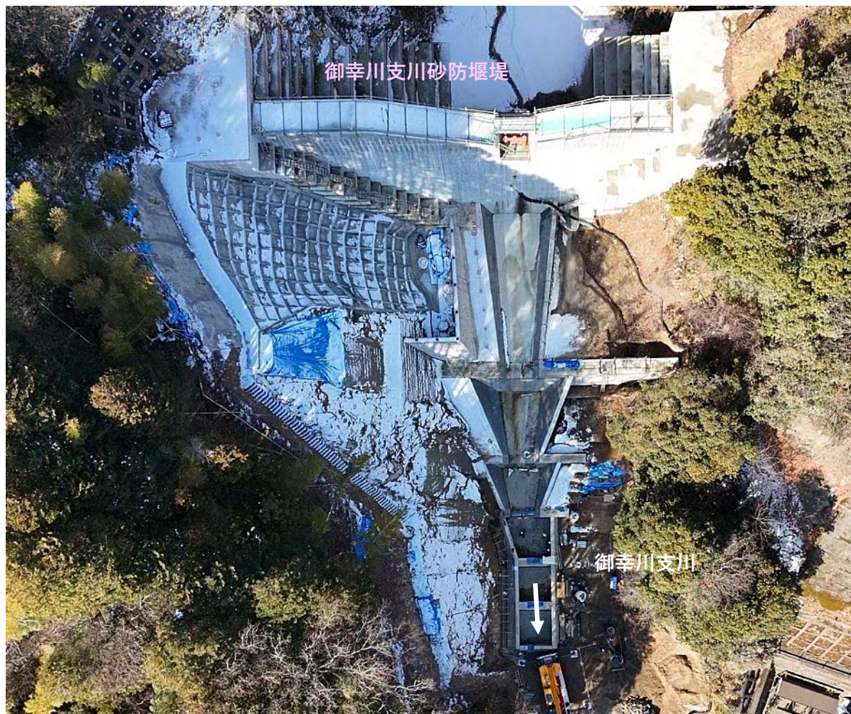
【施工状況（上空より）】