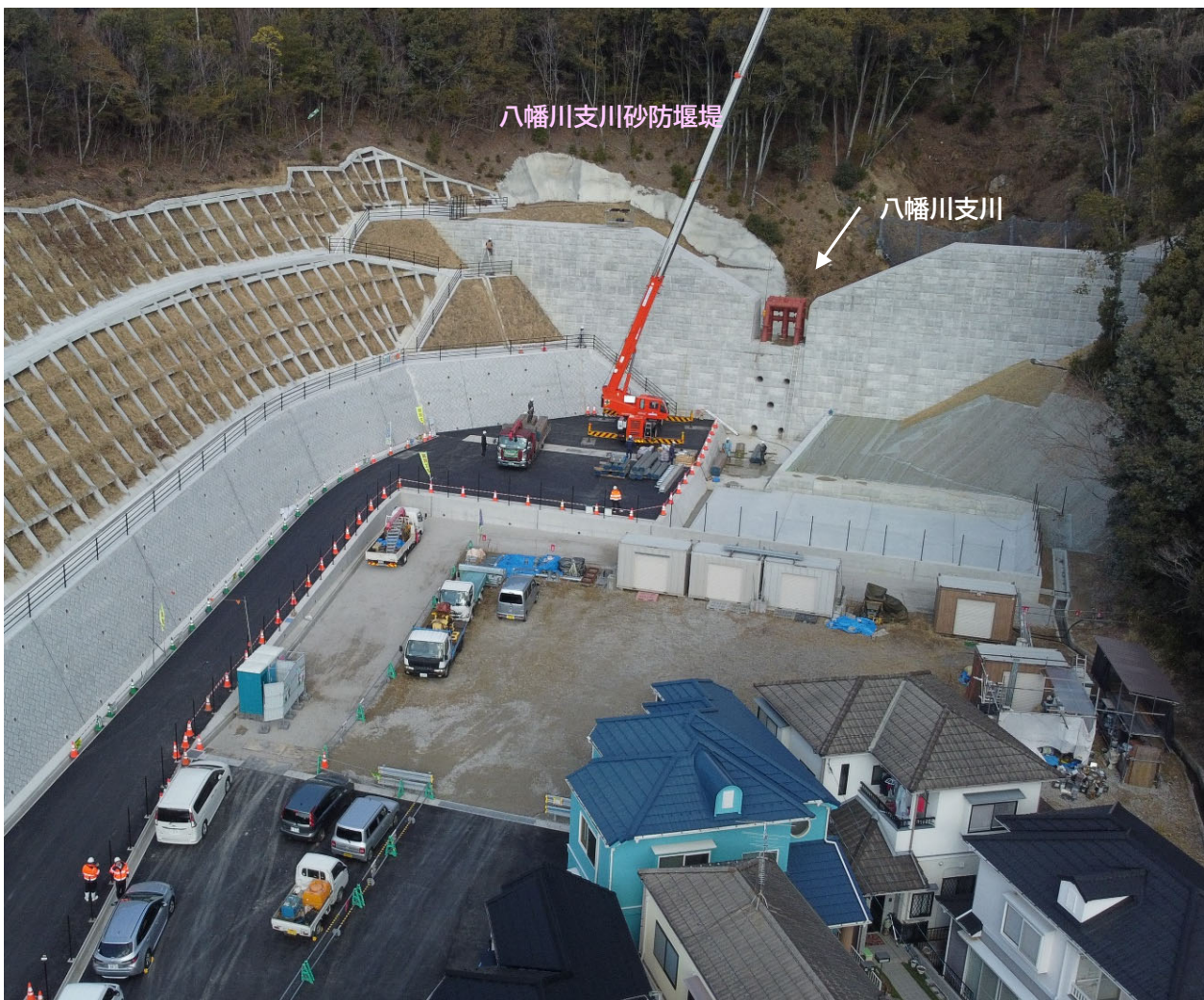
【施工状況（下流側より）】