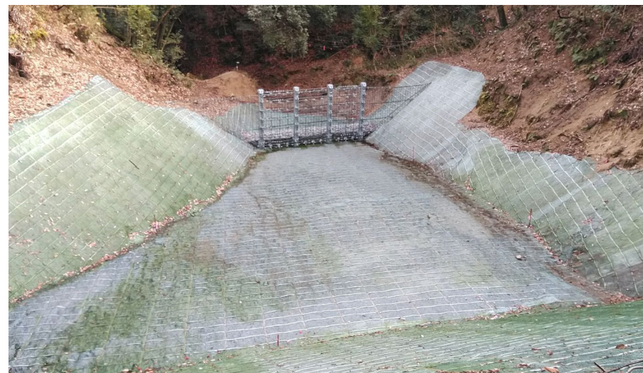
【施工状況：上流側土砂対策施工状況】 (御幸川支川砂防堰堤上流側土石流対策工) (上流から)