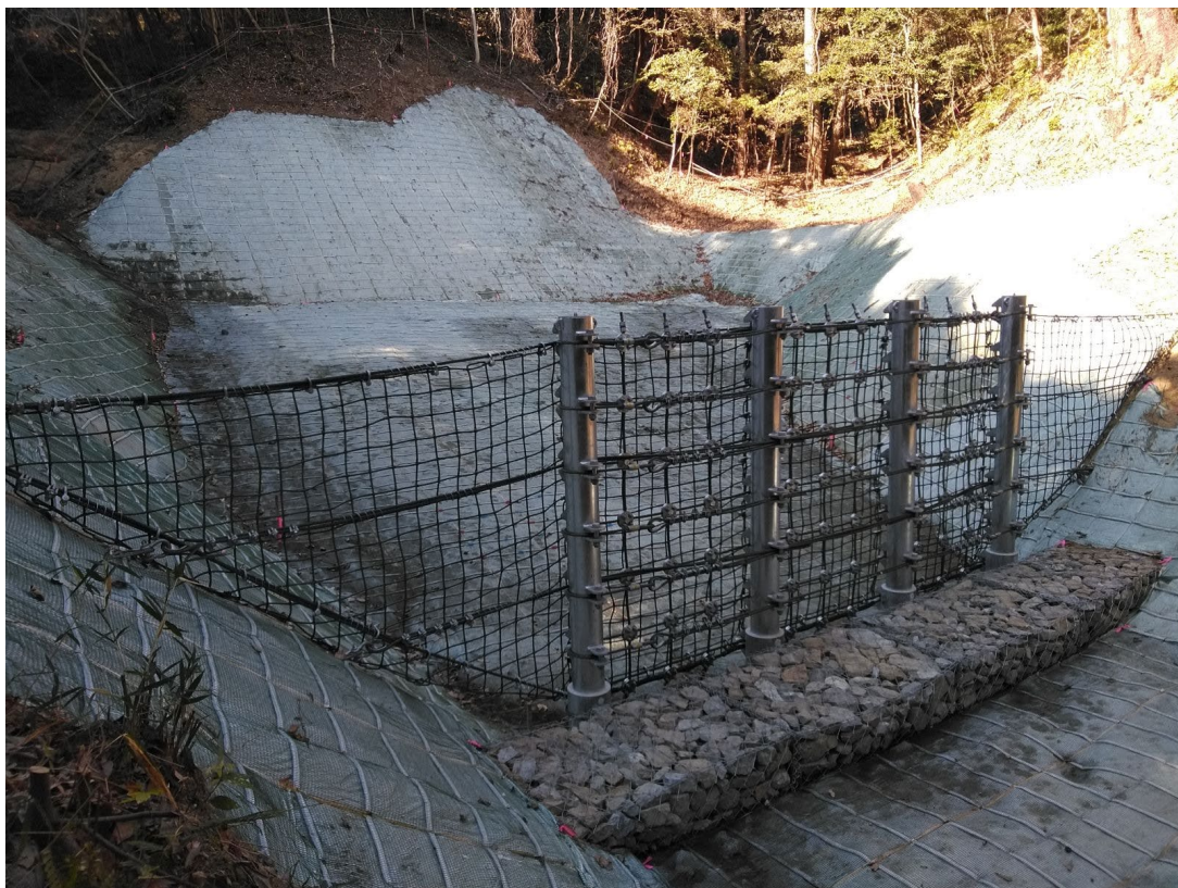
【施工状況：上流側土砂対策施工状況】 (御幸川支川砂防堰堤上流側土石流対策工) (下流から)