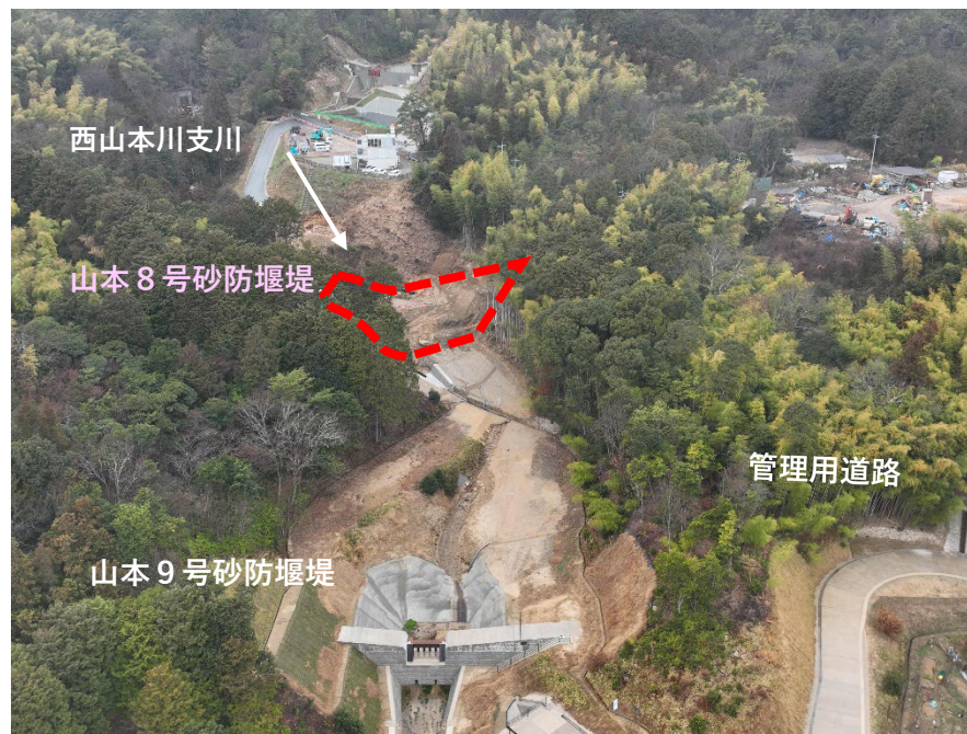
【 全 景 】