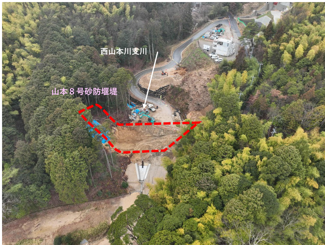
【 施工状況 】