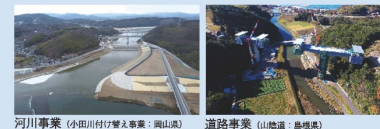
河川事業(小田川付け替え事業:岡山県) 道路事業(山陰道:島根県)

中国地方整備局は、社会資本(インフラ)の整備・管理を行い安心・安全で豊かな地域社会を支えることが私たちの使命です。そのための事業として河川やダム、砂防の整備・環境管理、道路の整備・維持管理、港等の整備、防災対策や復旧支援、まちづくりなどの事業を行っています。