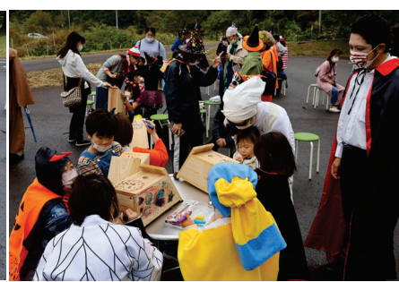
志津見ダム水没樹移植記念公園 神戸の森 巣箱にペイント