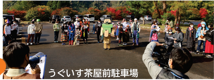
うぐいす茶屋前駐車場