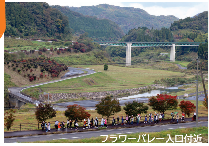
フラワーバレー入口付近