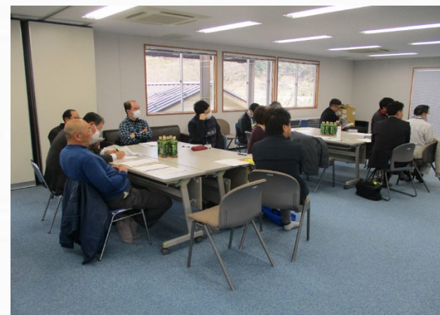
さくらおろち湖活性化ネットワーク会議