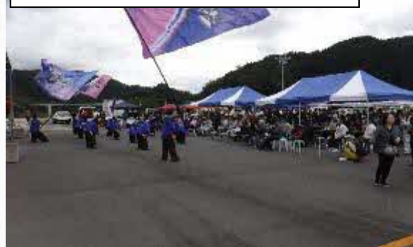
「さくらおろち湖祭り」の開催