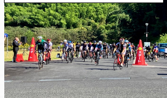
「奥出雲サイクリング」の開催