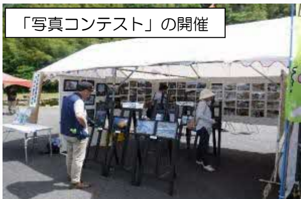
「写真コンテスト」の開催