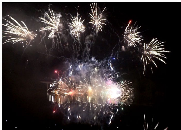
さくらおろち湖湖上花火