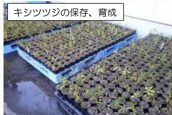
キシツツジの保存、育成