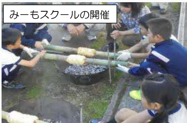
みーもスクールの開催