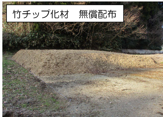
竹チップ化材 無償配布