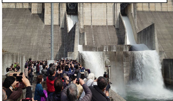
「クレストゲート点検放流」の開催