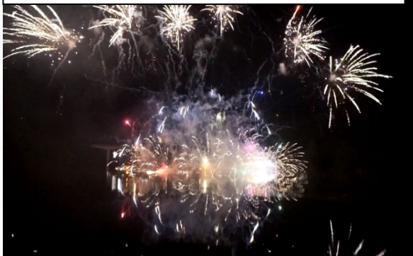
「さくらおろち湖 湖上花火」の開催