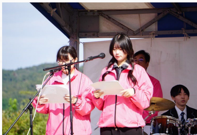
ボランティアスタッフ (さくらおろち湖祭り)