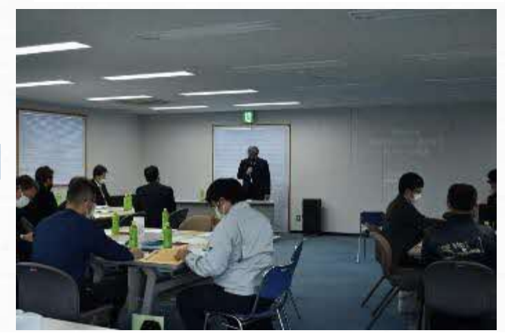
さくらおろち湖活性化ネットワーク会議