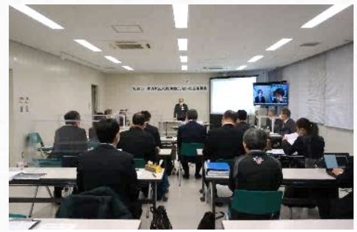
尾原ダム水源地域ビジョン推進委員会

役割 ● 委員会の企画・運営 ● ネットワーク会議の企画・運営 ● 連絡・調整 開催頻度 適宜開催(月1回程度) 参加メンバー ● 特定非営利活動法人 さくらおろち ● 雲南市 政策企画部 地域振興課 ● 奥出雲町 定住産業課 ● 島根県 土木部 雲南県土整備事務所 ● 国土交通省 中国地方整備局 出雲河川事務所 尾原ダム管理支所