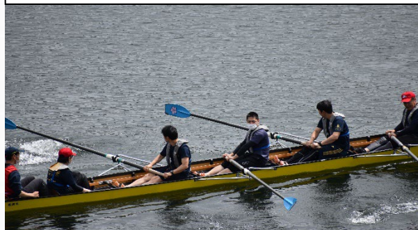
「さくらおろち湖お花見レガッタ」の開催