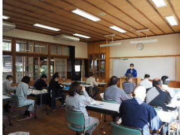
ビオトープづくり学習会

共感を広めるためにインターネット等を通じて情報を発信します。また、理解を深めるためのシンポジウムや学習会、生きもの調査イベントなどを開催します。また、各種団体が開催する環境学習活動にアドバイスやコーディネートをします。