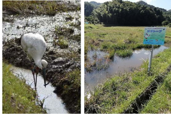
左：田んぼのよけじでドジョウを捕まえたコウノトリ 右：本協議会で試行している出雲市斐川町にある元休耕田の田んぼビオトープ

生きものを育む農業として農薬や化学肥料の使用を減らす方法や、土水路（よけじ）の維持管理・普及方法などについて考えます。休耕田の耕起や草刈りにより田んぼビオトープを作ったり、一年中、水をためる工夫をすることで、多様な生きものの生息地を広げます。