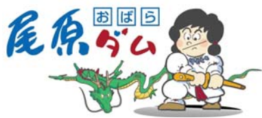
尾原ダムキャラクター「すさのおくん」