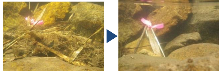
フラッシュ放流前