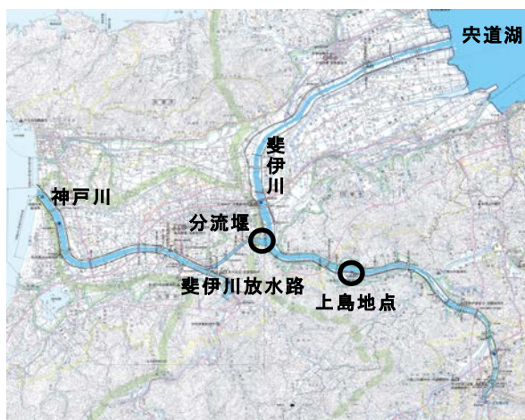
斐伊川放水路分流堰付近（8/17 22:30頃）